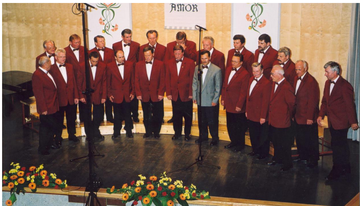
***** Slika: MPZ_Lasko.jpg ***** ***** tekst: Bo moj vnuk še pel domače pesmi ...

Začetek delovanja zbora sega v maj leta 1928. Danes zbor šteje 26 članov in pripravi štiri samostojne koncerte na leto, sodeluje tudi na revijah in drugih prireditvah in večkrat sodelujejo na pogrebnih svečanostih. Večkrat so sodelovali na pevskem taboru v Šentvidu pri Stični. Ob 70. letnici so izdali brošuro in audio kaseto.