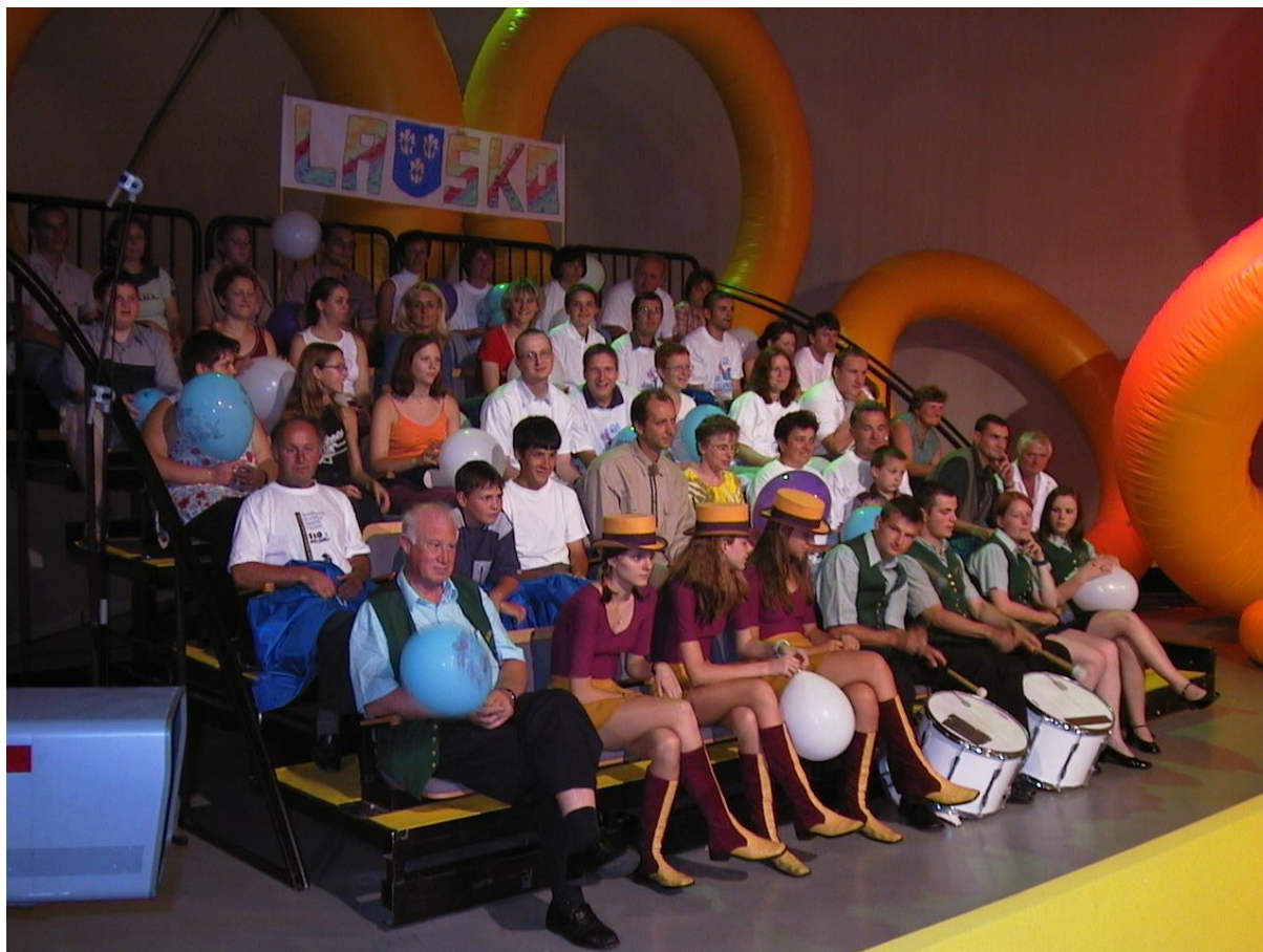
***** Slika: Mavrica.jpg ***** ***** tekst: Zvesta (in glasna) publika ob snemanju oddaje ...