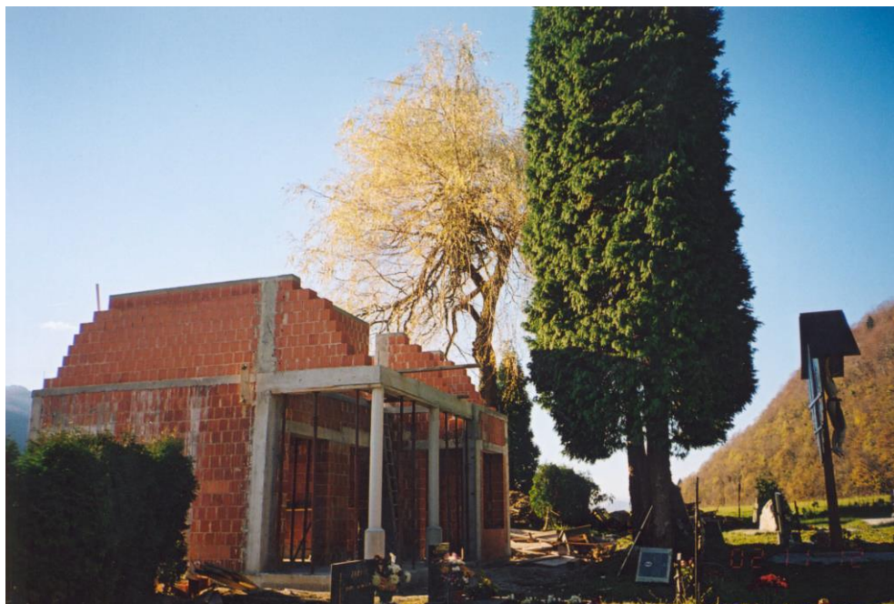
***** Slika: Zalnica.jpg ***** ***** tekst: Za spoštljiv in dostojen spomin ...