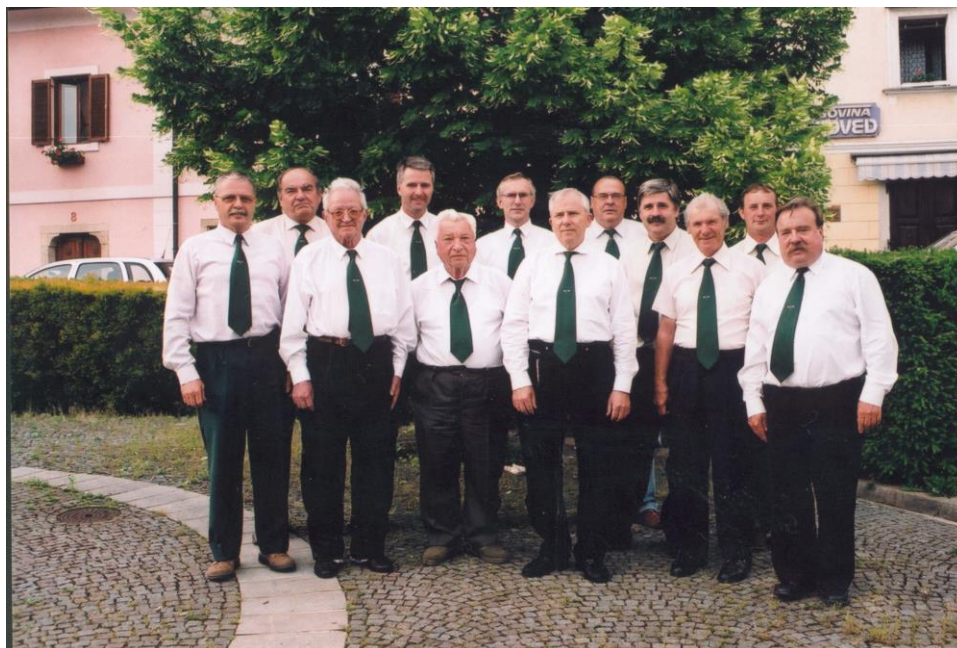
***** Slika: Cebelarji.jpg ***** ***** tekst: "Vodilni" roj laške čebelarke družine ...