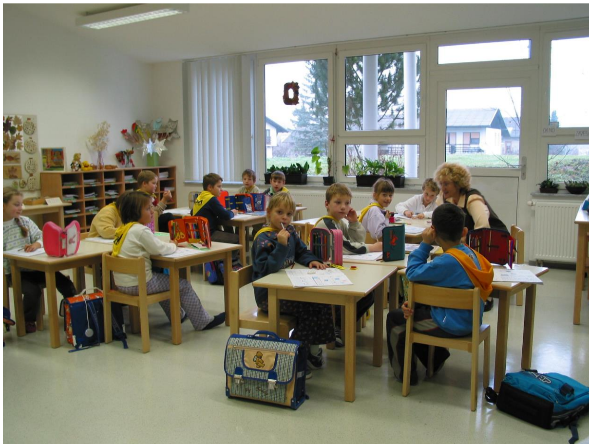
***** Sliki: Rimske.jpg ***** ***** tekst: Pri pouku v novi učilnici ...