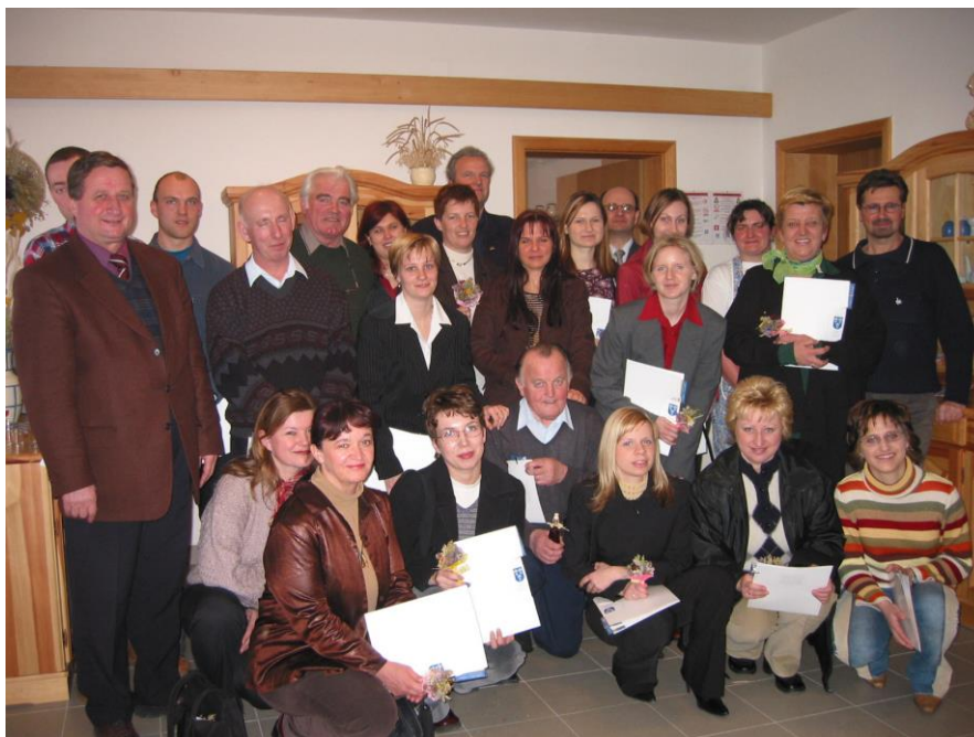
***** Slika: Vodniki.jpg *****