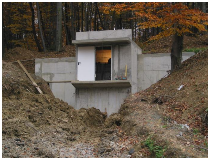
***** Slika: Vodohram.jpg ***** ***** tekst: Vodohram Globoko *****