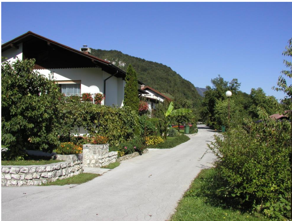
***** Slika: Trsteniška.jpg *****