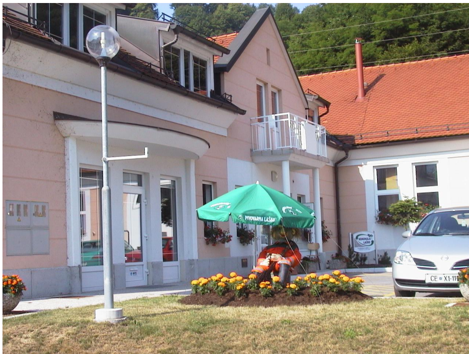
***** Slika: Komunala.jpg *****