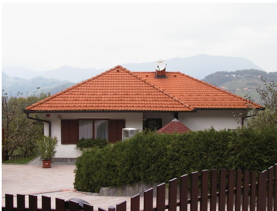
***** Slika: Čížek.jpg *****

V kategoriji najbolj urejena kmetija so bili naslednji rezultati: