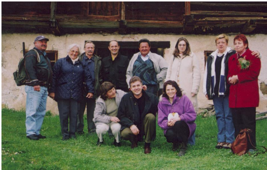
***** Slika: Možnar.jpg *****

Za nami je kar vrsta lepih prireditev, v katerih je vpeto delo članov društev, skupin in posameznikov iz laške okolice, znanja in veščin iz preteklosti, nekaj priučenega in naučenega, veliko prostega časa, volje in truda.