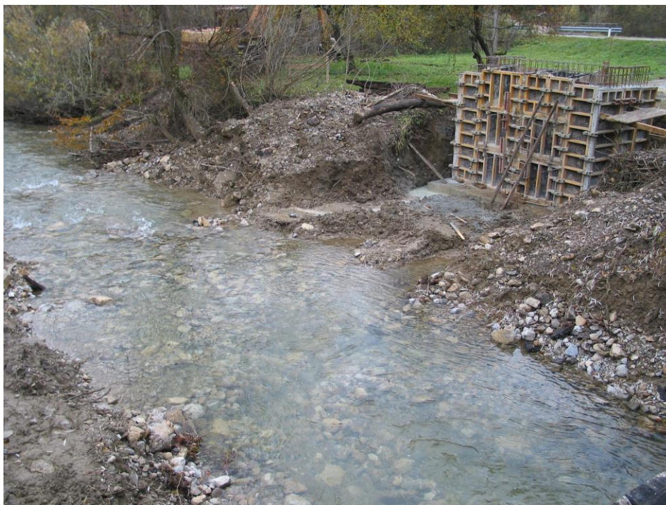
***** Slika: Gracnica.jpg *****

Material za ograjo in vozno površino iz lesa bodo zagotovili krajanji sami. Vrednost pogodbenih del znaša dobrih 7 MIO SIT.