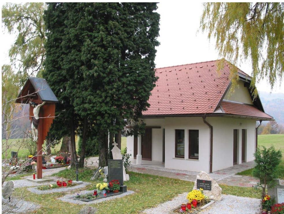
***** Slika: Žalnica.jpg *****

V občini smo sprejeli odločitev, da postopno obnovimo oziroma na novo zgradimo žalnice na pokopališčih, kjer jih še ni ali pa so v zelo slabem stanju. Tako smo v Širju nad Zidanim Mostom v letu 2002 pričeli z gradnjo nove nadomestne žalnice, objekt je bil letos dokončan in predan uporabi.