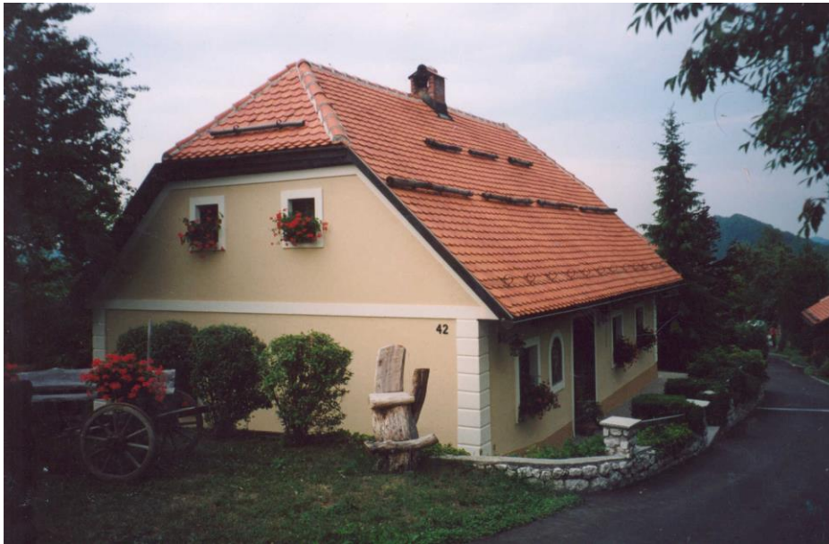
***** Slika: Križnik.jpg *****

V kategoriji najbolj urejen javni objekt je dosegla