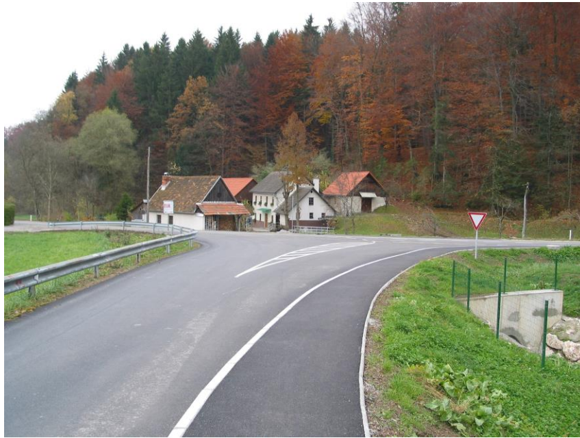
***** Slika: Brezno.jpg *****