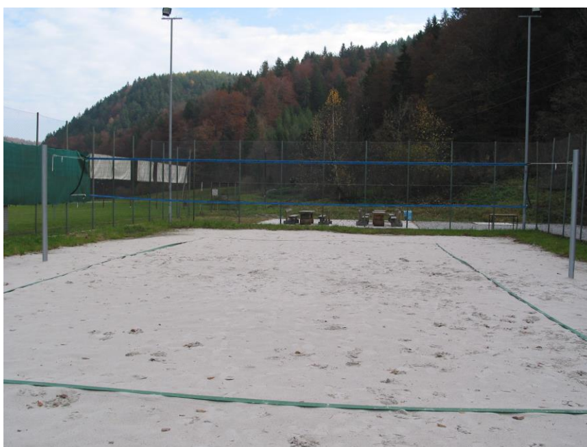
***** Slika: Rečica.jpg ***** ***** tekst: Igranje odbojke na mivki je privlačno za stare in mlade. *****

Športno društvo Rečica je v sodelovanju s krajevno skupnostjo Rečica, ki je bila nosilec investicije, in ob finančni pomoči podjetij TIM Laško in Pivovarna Laško, uredilo na obstoječem igrišču v športnem parku Huda jama novo igrišče za odbojko na mivki v vrednosti dobrih 3 milijonov tolarjev. To je v občini prvo in edino igrišče za športno panogo, ki ima zlasti med mladimi veliko privrženecv.