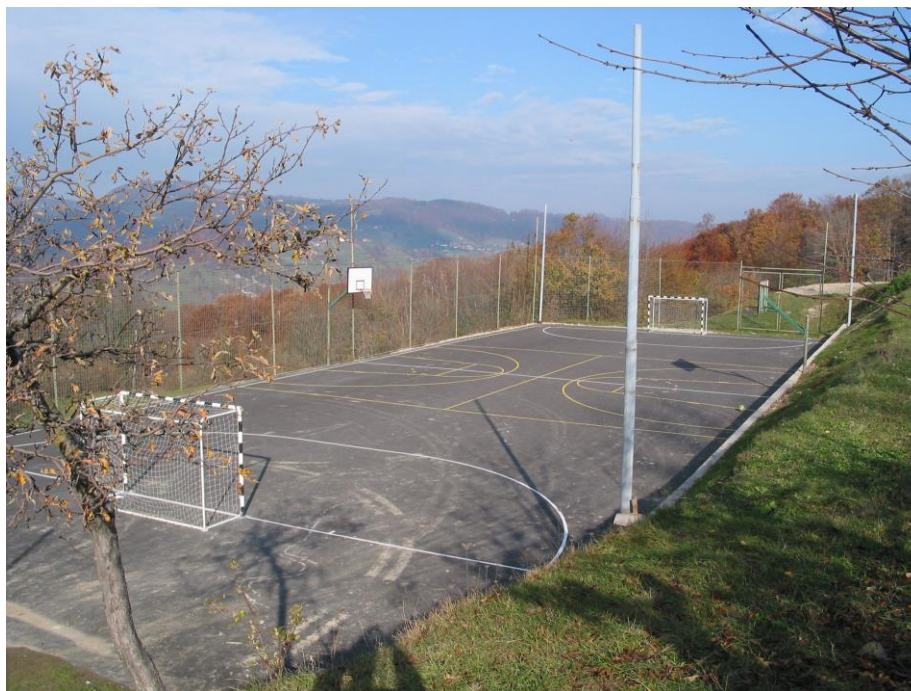
***** Slika: Vrh.jpg ***** ***** tekst: Urejeno športno igrišče je tudi na vasi pogoj za športno rekreativno življenje. *****