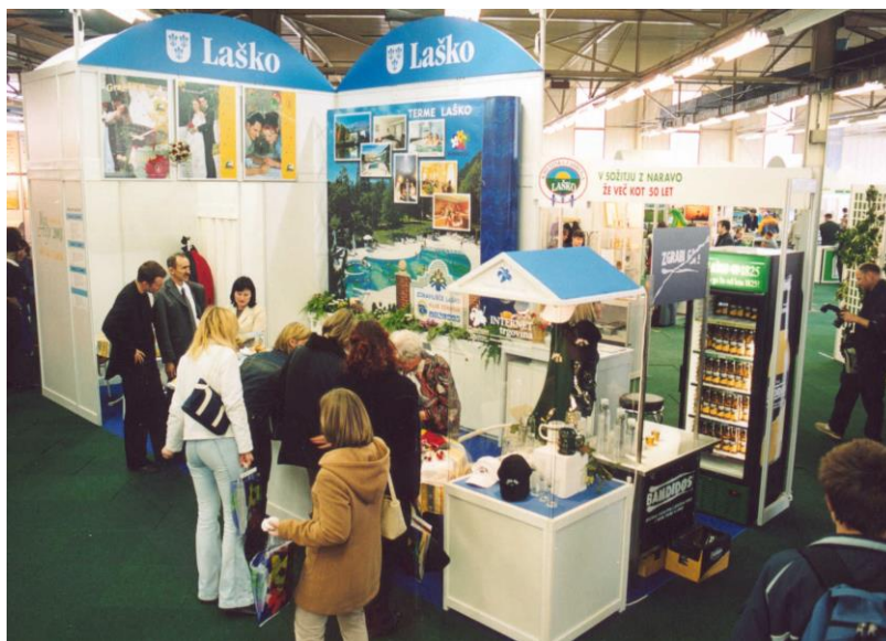
***** Slika: Sejem.jpg *****

Občina Laško se je predstavila na sejmu Alpe-Adria v Ljubljani, ki je potekal od 20. do 23. marca 2003. V okviru Občine Laško so se na sejmu predstavili Zdravilišče Laško, Turistično društvo Laško, Pivovarna Laško, Gostinstvo Laznik, Kmetijska zadruga Laško ter Agencija za razvoj turizma in podjetništva občine Laško. Udeleženci so se predstavili s promocijskim materialom, degustacijo hrane in piva ter kulturnim programom.