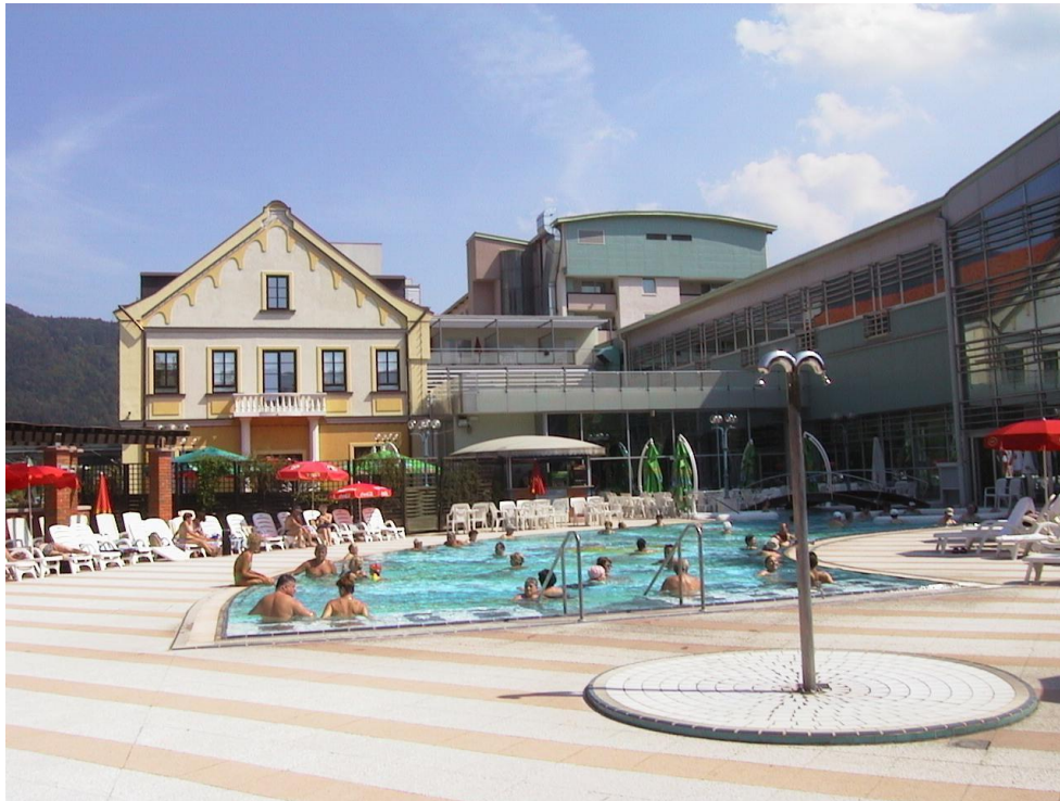
***** Slika: Zdravilišče.jpg *****

V kategoriji najbolj urejena vas, naselje, ulica: