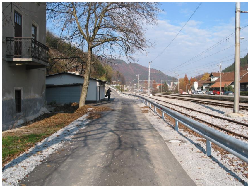
***** Slika: Servisna.jpg *****

Z izgradnjo gasilskega doma v Debru je obstajala bojazen, da v primeru visokih voda gasilske enote le s težavo prispejo do mestnega jedra. Zato je bilo strateškega pomena, da se kar najhitreje uredi tako imenovana servisna interventna cesta, ki bo ob izjemnih situacijah omogočala vozilom gasilcev, prve pomoči in policiji nemoteno posredovanje. V poletnih mesecih so zgradili 270 m interventne ceste od Branceta do Vile Karola vzdolž železniške proge Laško–Celje.