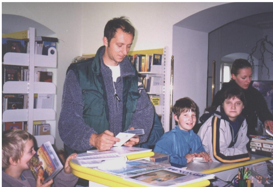
***** Slika: Knjižnica Laško – Knjiznica.jpg ***** ***** tekst: Veliki in mali so radi v knjižnici ...

Pomemben mejnik v našem razvoju pomeni leto 1995, ko smo vstopili v računalniški sistem Cobiss. V nekaj letih smo vnesli vanj svoje gradivo in dobili vpogled v podatke in stanje o knjižničnem gradivu vseh slovenskih splošnih knjižnic, NUKa in številnih univerzitetnih, specialnih in drugih knjižnic in informacijskih centrov doma in po svetu. V našem gradivu je vse več publikacij na elektronskih nosilcih, prisotne imamo domače in tuje računalniške baze podatkov. Prek interneta lahko pregledujete podatke o našem gradivu, možnostih izposoje in obiščete nekatere baze podatkov. S svojo ponudbo smo tako vse bolj zanimivi za osnovnošolce, dijake, študente in ostale občane. Manj smo zadovoljni z obiskom odraslih, še posebej starejših.