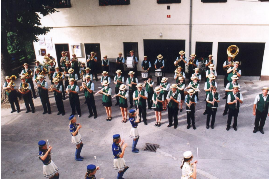
***** Slika: Godba Laško – GodbaL.jpg ***** ***** tekst: Igramo tako ubrano, da ni težko zaplesati.

Godba ima letno do 80 samostojnih nastopov doma in v tujini. V letu 1997 je godba posnela prvo zgoščenko in kaseto, ter se po rednih tekmovanjih slovenskih godb uvrstila v srednji težavnostni stopnji s srebrno listino. Mažoretna skupina je vključena v Mažoretno zvezo Slovenije ter se poleg rednih državnih tekmovanj udeležuje tudi evropskih mažoretnih tekmovanj; letos je to bilo v Angliji.