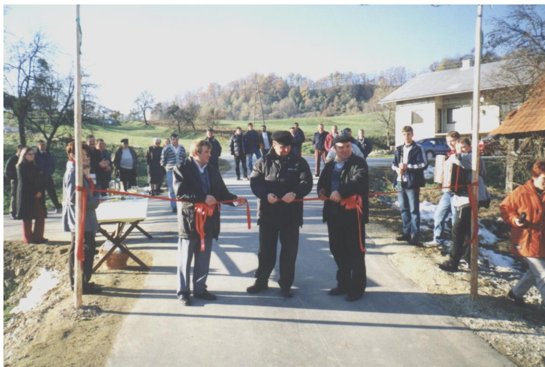
***** Slika: Preplastitev ceste – Cesta.jpg ***** ***** tekst: Ne bomo več požirali prahu !

Najpomembnejše investicije na področju sanacijskih del so bile: sanacija zelo poškodovanega odseka lokalne ceste Mala Breza – Trobni dol z asfaltno preplastitvijo, sanacija poškodovanega cestnega odseka Rečica – Koder z asfaltno preplastitvijo, sanacija po poplavi uničenega odseka Briše – Obrežje z asfaltno preplastitvijo, in sanacija odseka Lahomno – Stopce s celovito ureditvijo odvodnjavanja. Zaradi neugodnih vremenskih razmer v novembru, bodo sanacije na cesti Lože – Konc, Kuretno – Košir ter Belovo - Sedraž in dokončanje sanacije na cesti Lahomno -Stopce izvedene v letu 2002.