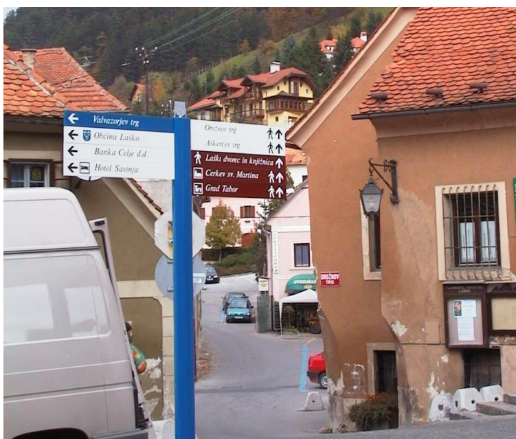
***** Slika: kažipoti v Laškem – Kažipot.jpg ***** ***** tekst: Da se ne bi izgubili ...

Mesto Laško je opremljeno z novimi kažipoti. S to pridobitvijo je zaokrožena podoba samega mesta. Obiskovalci in občani tako lažje in hitreje spoznavajo znamenitosti in druge pomembne objekte Laškega.