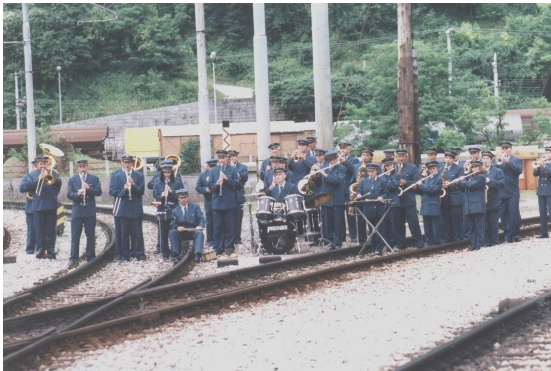
***** Slika: Godba Zidani Most – GodbaZM.jpg ***** ***** tekst: Železničarji so vedno aktivni, kadar ne vozijo, igrajo !

Danes godba šteje 56 članov. Izkušnost se prepleta z mladostjo ter tako ohranja železničarsko tradicijo. Godbenike danes vodi dirigent mlajše generacije izobraženih glasbenikov.