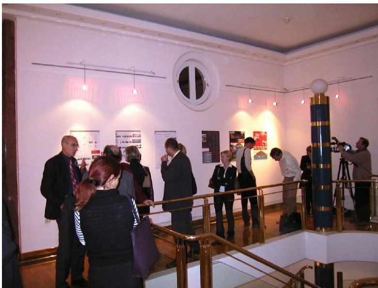
***** Slika: Predstavitev delavnice – UrbDelavnica.jpg ***** ***** tekst: Utrip z razstave v Kulturnem centru.

Predlogi in zamisli predstavljajo možna izhodišča za izdelavo bodočih prostorskih planov in dokumentov, hkrati pa verjamemo, da se bo katera od zamisli izpeljala tudi v praksi.