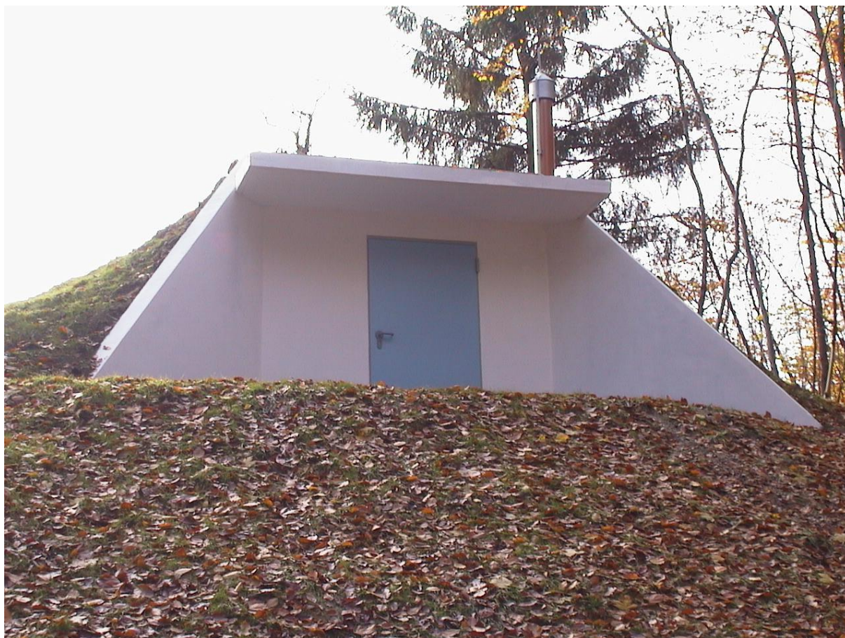
***** Slika: Vodohram Ojstro – Vodohram.jpg ***** ***** tekst: Poskrbeli smo za zdravo pitno vodo. *****

Že vrsto let se predel naselja Ojstro ubada s pomanjkanjem vode. V ta namen je bila leta 1998 pripravljena projektna dokumentacija. Na začetku leta 2001 je bilo pridobljeno gradbeno dovoljenje, izbran najugodnejši izvajalec, vrednost del pa je bila 33 MIO SIT. V letu 2002 nameravamo nadaljevati z razvodom sekundarnega omrežja.