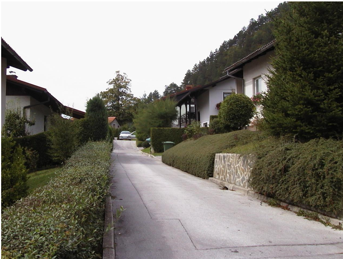
***** Slika: Oš Rečica – Sola.jpg ***** ***** Slika: naselje Taborje – Naselje.jpg *****