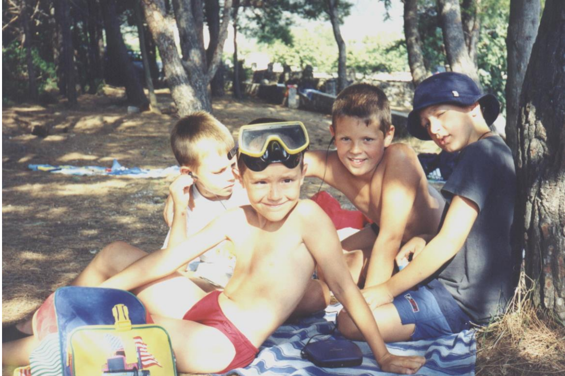
***** Slika: Letovanje otrok – Otroci.jpg ***** ***** tekst: Še malo ... pa gremo v vodo !