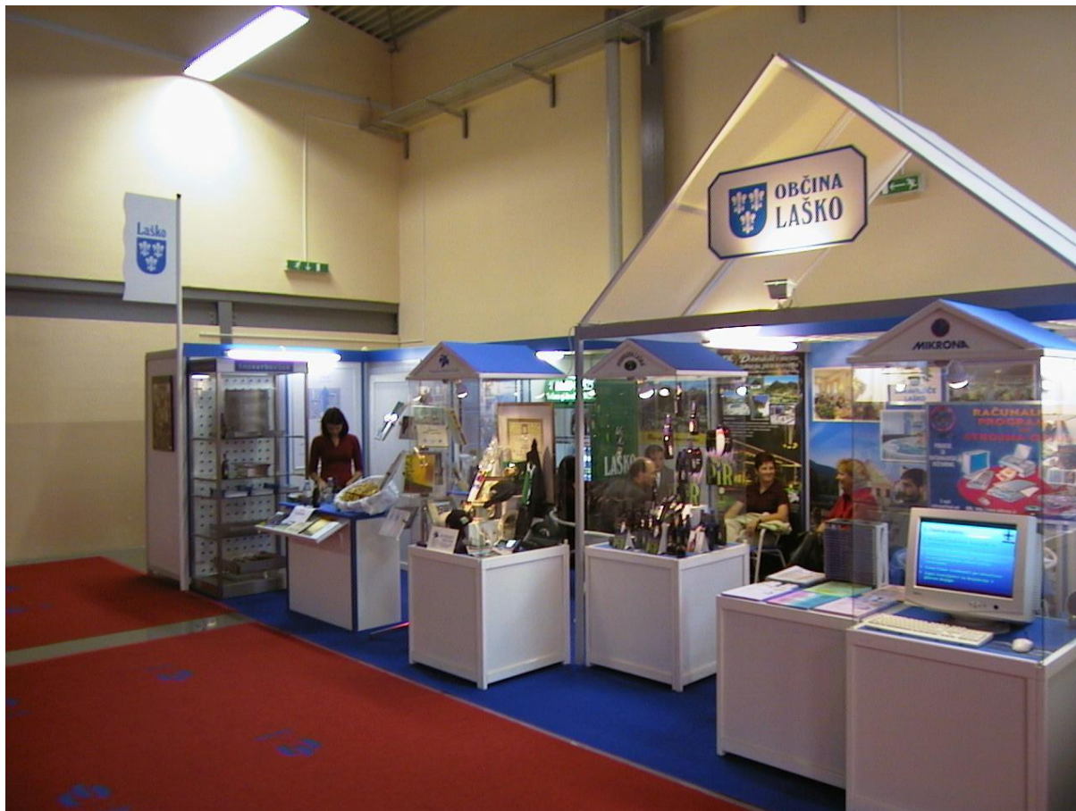
***** Slika: MOS Celje – Mos.jpg ***** ***** tekst: Občina se predstavi ...