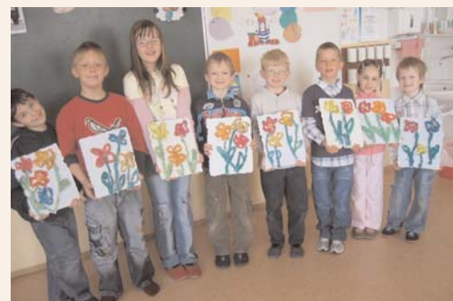
Učiteljica podružnične šole Lažiše

Narava je za otroke kot odprta knjiga in najbolj idealna učiteljica, če le imajo dovolj odprte oči in ob sebi nekoga, ki jim je pripravljen nenehno odgovarjati. Šole na podeželju imamo zato veliko prednost, ker smo dobesedno vpeti v to čudovito dogajanje narave, za katerega pa imajo odrasli vse manj časa in interesa. Učenci šole Lažiše se že zavedamo, da nam ne sme in ne more biti vseeno za naravo in njeno prihodnost, ki je tudi naša edina priložnost. Učenci naše šole vsako leto ob dnevu zemlje v okolici šole posadimo drevesca, pomagamo pri sajenju lončnic, čiščenju okolice. Letos pa smo se odločili, da bomo morda kakšno drevo obvarovali, če bomo sami izdelali ekološki papir. Iz porabljenih listov smo izdelali eko papir, ki pa je bil podlaga za posebno lepljenko, na katero je vsak učenec nalepil šopek iz časopisnega papirja. To je bilo najlepše darilo materi Zemlji za njen rojstni dan.