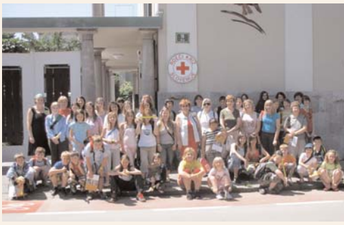
Člani krožkov RK so se ustavili tudi na sedežu RK Slovenije v Ljubljani.