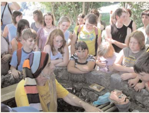
Na poti k vaški situli je krožkarje zabaval vodni škrt.

Vsem mentoricam krožkov RK, vodstvom šol in ravnateljicam, ki so pokazale polno mero razumevanja za delovanje krožkov in izvajanje njegovega programa, se zahvaljujemo. Naša velika želja je, da delo krožkov uspešno nadaljujemo tudi v prihodnje in da bomo omogočili mladim, da sodelujejo v eni od prijetnih in zanimivih druženj med številnimi aktivnostmi, ki sicer potekajo na šolah. Torej tudi v Šentrupertu, Rečici, na Svibnem, Vrhu in v Zidanem Mostu.