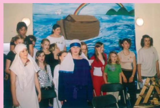
Skupina Lilija bo s predstavo Noetova barka nastopila 31. avgusta na župnijskem dvorišču. Na njej bodo nastopili tudi glasbeniki z različnimi glasbil.

S skupino Lilija (KD Koral) smo se v četrtek, 3. julija, udeležili pevsko-dramskih in duhovnih vaj na vikendu pri družini Bolčina na Polani pri Jurkloštru. Ravno takrat pa se je zgodila nesreča v Sevnici, v kateri je umrlo 13 ljudi. Peljali so se s kajaki po Savi. To je bila huda nesreča in se mi zdi prav, da sem jo omenila, ker se je zgodila na isti dan, ko smo prispeli na Polano.