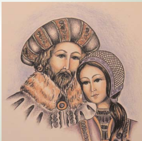
Ilustracija Friderik in Veronika, Severina Trošt Šprogar