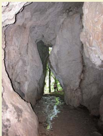
Vhod v jamo v dolini reke Gračnice.

Jamarji Koroško-šaleškega jamarskega kluba Speleos-Siga Velenje smo v septembru zaključili prvo fazo projekta, ki je bila namenjena predvsem iskanju in raziskovanju jam na območju Občine Laško, delno pa tudi na območju drugih treh občin. Ugotovili smo, da so obstoječi podatki o že registriranih jamah večinoma nepopolni in zastareli. Jame so imele napačno določene lege vhodov, opisov dostopov do jam večinoma ni bilo.