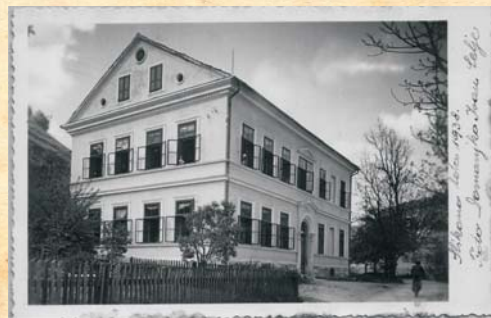
Šola v Šmarjeti leta 1938.