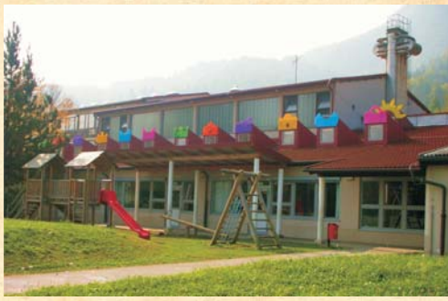
Prizidek prvega triletja, zgrajen l. 2002.

Z več kot 300 vpisanimi učenci šola kmalu ni več zagotavljala normalnih delovnih pogojev. Novi prizidek, s katerim je bil zagotovljen enoizmenski pouk, je bil vveljavljen septembra 1988.