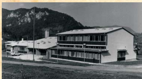
Nova šola l. 1972.

Podružnične šole Sedraž, Lokavec in Lažiše so se priključile centralni šoli leta 1962, Jurklošter pa 1967. Zgodba Jurkloštra pa je bolj pestra, saj začetki šolstva segajo v