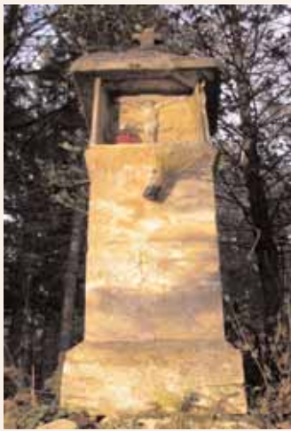
Kužno znamenje iz leta 1596 ob poti v Kuretno.

V 16. in 17. stoletju je v naših krajih, tudi na območju Laškega, pogosto kosila epidemija kuge. Posebno huda je bila v letih 1646–1647, torej med 30-letno vojno (1618–1648). Vojne razmere in z njimi povezane posledice: pomanjkanje, lakota, nehigiena, nerazvitost medicine so epidemije kuge še pospeševale. Učinkovitega zdravila proti njej pravzaprav ni bilo. Zato ni čudno, da so kugo skušali zatirati z za današnje pojme neverjetnimi "zdravili" in obrambnimi ukrepi. Tako najdemo v knjigi Orožnova zgodovina dekanije Laško (Celjska Mohorjeva družba, 2009) uglednega rojaka in pomembnega zgodovinarja, stolnega