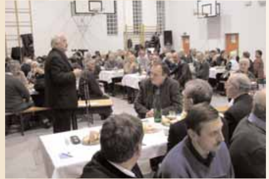
Rudarskega druženja se udeležuje okrog 160 aktivnih ter upokojenih rudarjev

sv. Barbare. Pomembno je, da to ni kadarkoli, ampak na dan, ko je njen god. V Sedražu pri gasilskem domu so se tega dne skupaj zbrali upokojeni in aktivni rudarji v uniformah ter od tam s