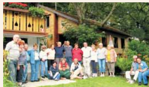
MePZ Jesen na intenzivnih vajah v naravi pod Velikim Kozjem

Pred dobrim letom se je bralcem in bralkam biltena predstavil novonastali pevski zbor, ki deluje pod okriljem Društva upokojencev Laško. Od takrat pa