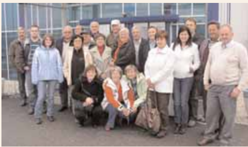
Člani etno odbora na strokovni ekskurziji

Okrog 70 delovnih opravil in ljudskih šeg, ki sodijo v okvir ljudske dediščine, nam je uspelo v tem obdobju postaviti na svetlo. Nastalo je veliko pisnega materiala, fotografij, avdio in video posnetkov, dve brošuri, avdio kasetala ljudskih pevcev in godcev, novinarskih zapisov in spominov. Med nami so se spletla številna poznanstva z ljudmi v laški okolici in