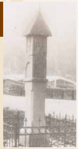
Gotsko kužno znamenje iz leta 1600 v Sp. Rečici.