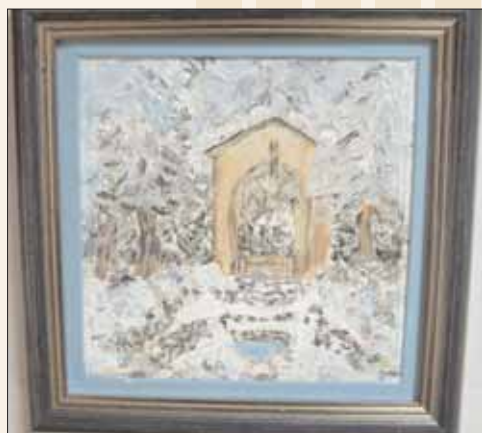
Avtorica slike: Irena Horjak