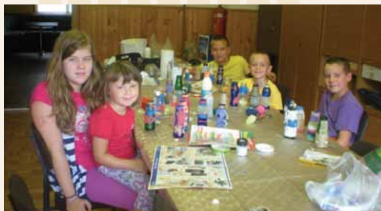
Delavnice za otroke so v Rečici vedno lepo obiskane