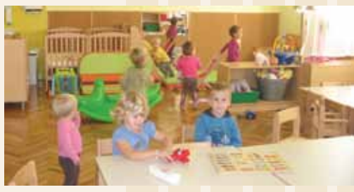
Vrtec v PŠ Rečica

Število otrok, vpisanih v vrtec, se iz leta v leto povečuje. V letu 2006 je bilo vpisanih 343 otrok, letos pa se je v Vrtec Laško vpisalo 500 otrok. Zaradi povečanega vpisa vsako leto odpremo nov oddelak. V letošnjem letu smo konec aprila, ko je bil vpis otrok zaključen, imeli 42 otrok, ki niso imeli prostora v vrtcu. Zaradi tega smo se odločili, da v PŠ Šentrupert in PŠ Rečica odpremo