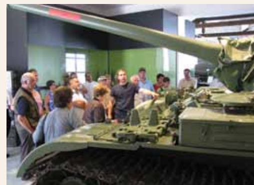
Na 33. ekskurziji članov RK Šentrupert malo drugače

Pot smo sklenili z nakupom krofov na Trojanah. Vsem lahko sporočimo, da nam je ekskurzija lepo uspela, in žal nam je, ker niste mogli biti z nami.