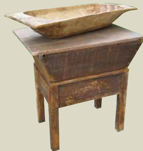
Na fotografiji je neček, najden v okolici Laškega. Postavljen je na mentrgo, mizo s koritom za mesenje.

Gibanje je smisel, ki je v življenju rdeča nit. Je recept za zdravo življenje. Nikakor ne razmišljajte, da bi otroka lahko razvadili. To je nemogoče, posebej v prvih treh mesecih. Potrebuje le bližino, varnost, kar pa je zelo pomembno za poznejši razvoj njegove samozavesti.