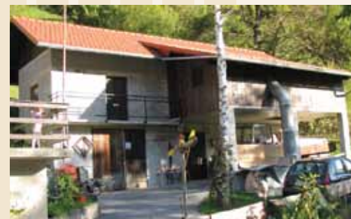
Gospodarsko poslopje družine Maček znova služi svojemu namenu