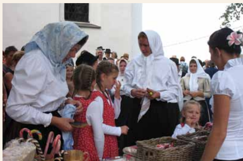
Za pridne otroke lectov konjiček ali punčka