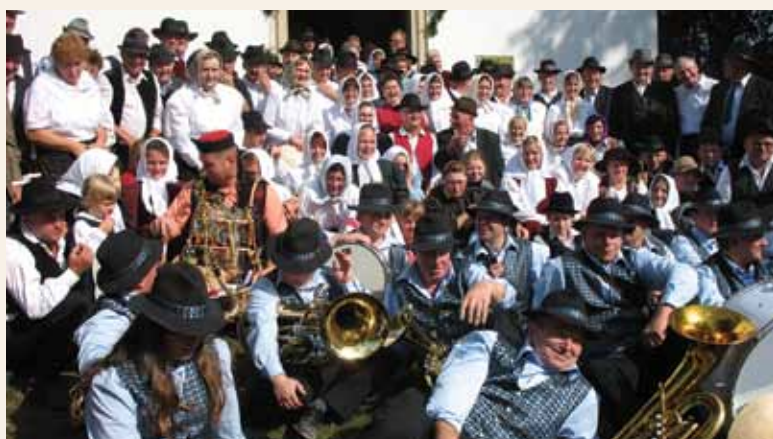
Poromali so k maši