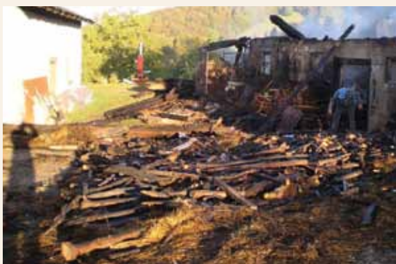
Na pogorišču naslednje jutro