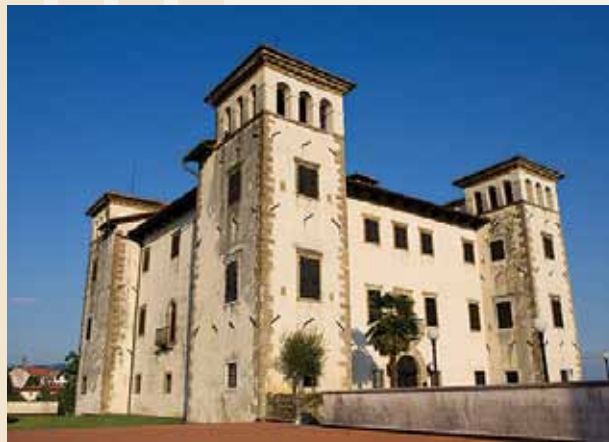
Grad Dobrovo, renesančni dvonadstropni utrjeni dvorec z začetka 17. stoletja