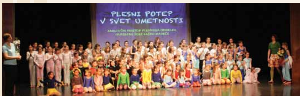
Ples skupinska

turnega centra Laško v torek, 5. aprila, in v sredo, 6. aprila, ko je potekala v sklopu Območne plesne revije Zavrtimo se in