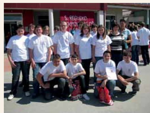
Tekmovalni ekipe iz obeh osnovnih šol