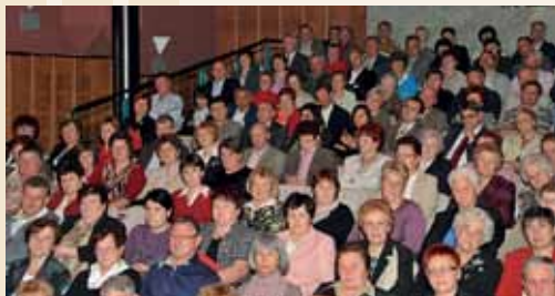
Prvega srečanja se je udeležila večina prostovoljk in prostovoljcev z gosti iz občin Laško in Radeče.

delavka Rdečega križa Slovenije. Za zaključek pa smo za dušo in srce prisluhnili enournemu koncertu Adija Smolarja, ki ga je v znak hvaležnosti za njihovo delo in pomoč vsem podaril sekretar ob njegovem jubileju. S prijetnimi občutki in odmevi, da smo nekaj lepega naredili tudi za naše marljive prostovoljce, smo prepričani, da bomo podobno druženje pripravili še kdaj.