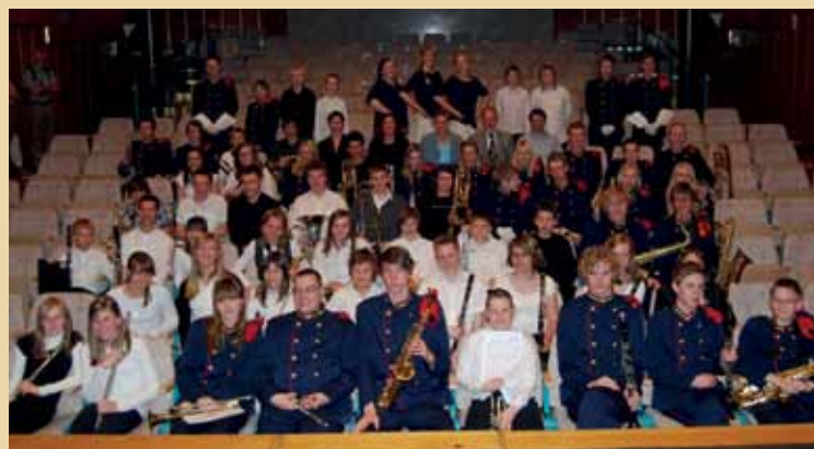
Obisk s Švedske