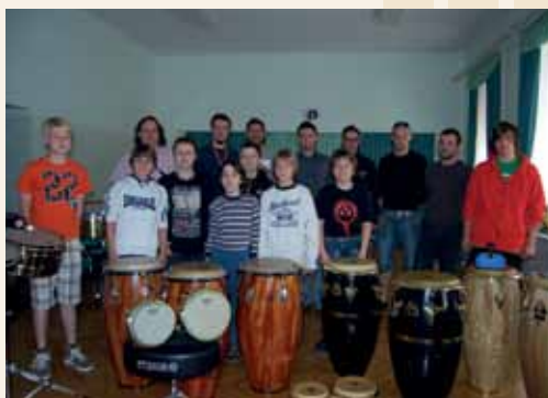
Tolkalska delavnica 2011

V nedeljo, 10. aprila, je na Glasbeni šoli Laško - Radeče potekala delavnica na temo »latin percussion«. Namen te delavnice je bil predstaviti eno od »družin« tolkal, saj pojem tolkala zajema širok spekter takšnih glasbil. Učni načrt na glasbenih šolah ne vključuje učenja latinskih tolkal, zato smo se odločili, da skozi delavnico približamo tolkala učencem in tudi drugim. Udeleženci so bili učenci tolkalnega oddelka iz Laškega in Radeč, delavnice pa so se udeležili tudi tolkalci lokalnih godb na pihala.