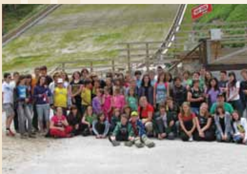
Udeleženci ekskurzije krožkov RK v Planici

Bogato dejavnost krožkov smo tudi tokrat sklenili z zaključno ekskurzijo tistih učencev, ki so čez vse leto marljivo sodelovali in pomagali mentoricam pri izvedbi programa. Skupaj z mentoricami in dvema avtobusoma učencev članov krožkov RK smo tokrat obiskali nekaj biserov naše lepe Slovenije. Podali smo se v dolino Vrat pod Triglav, še prej pa smo se ustavili in povzpeli do slapa Peričnik. Ekskurzijo smo nadaljevali z obiskom doline pod Poncami, ki čaka obiskovalce v objemu lepih gora in kjer je, kot vemo, svetovno znano prizorišče smučarskih poletov Planica. V drugačnem letnem času in vremenskih razmerah smo si ogledali skakalnice in letalnico ter se povzpeli do njene odskočne mize. Do tja smo našteali 600 stopnic. Nazaj grede smo se ustavili še pri izviru Save Dolinke pri Zelencih. Našo pot smo sklenili v restavraciji v Lescah na Gorenjskem, kjer smo se naužili lepote s pogledom na okolico in se razživeli na različnih igralih. Nam je dan minil v prijetnem druženju in vzdušju, prepričani pa smo, da tudi udeležencem izleta, zato se z vsemi veselimo novih spoznanj in druženj tudi pri krožkih RK v novem šolskem letu.