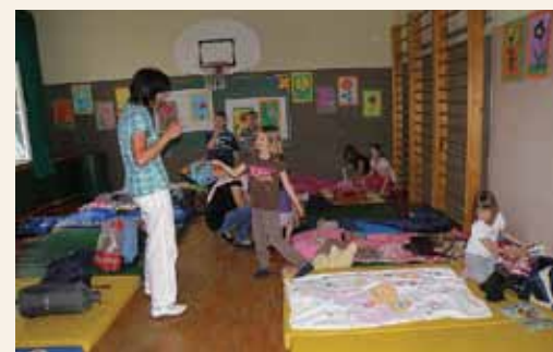
Spalnica za eno noč in pravljice za lahko noč.