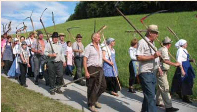
»Zdaj smo delo dokončali,« so zapeli kosci in grabljice pri vračanju z velikega travnika.