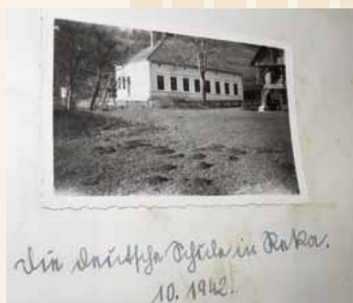
Šola v času 2. svetovne vojne (1942)

Šolstvo na Reki se je začelo že daljnega leta 1885 v preurejeni nekdanji gostilni na zahodnem hribčku nad današnjo šolo in od takrat so ohranjeni