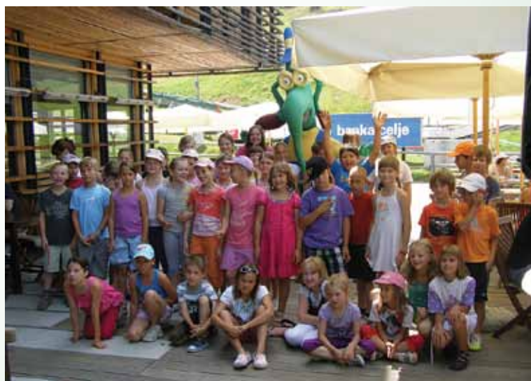
Nagrajence projekta je na Celjski koči obiskal tudi Ekorg.