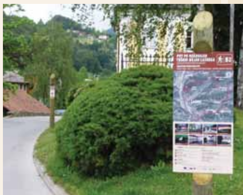
Izhodišče poti na Aškerčevem trgu