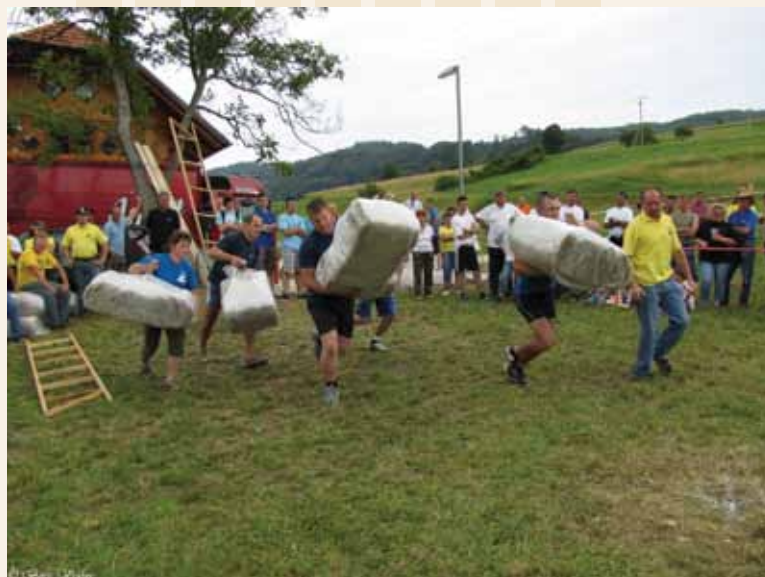
Zmagovalci: Zmagovalna ekipa hiti postavljat slalomske progo.