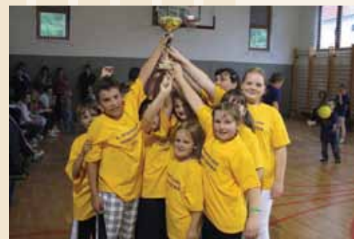
Zmagovalci s pokalom