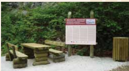
Urejeno počivališče ob poti (pod Žikovskim brdom)

Kratek opis poti: od izhodiščne table poti B2 (na Aškerčevem trgu, nasproti cerkve sv. Martina) se napotimo po asfaltni cesti mimo Muzeja Laško in Knjižnice Laško. Vzpenjamo se pod zahodnim delom Huma, mimo Blaževe skale in Tovstim. Nato prečkamo zahodno pobočje Žikovskega brda do ceste, ki pelje na Ojstro, in nadaljujemo do prevala v vas Trojno. Spustimo se v dolino potoka Lahomnica, pri mostu zavijemo desno na glavno cesto proti gostišču Čater in cerkvi Matere božje v Marija Gradcu ter se po cesti ob Savinji vrnemo na izhodišče v Laškem.