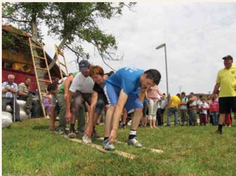
Natikanje smuči: Vodje ekip so prikazali, kako si je treba pravilno nataktni smuči.