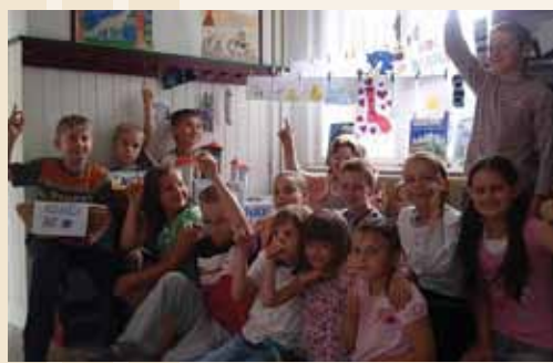
Kdo bi spanje v šoli ponovil? Vsi!!!

Zbrali so se ob 17. uri, oddali vstopnico (staro nogavico in knjigo), se poslovili od staršev in se prepustili literarni domišljiji v svetu gradov. Zabavali so se ob igri Maks v gradu strahov, uživali v napetem iskanju skritih zakladov in v kostumih predstavili življenje grajskih junakov. V skupinah so tudi ustvarjali: sešili nogavično pošast, zgradili grad, predstavili najljubšo knjigo ... Večerna uspavanka in pravljica za lahko noč je