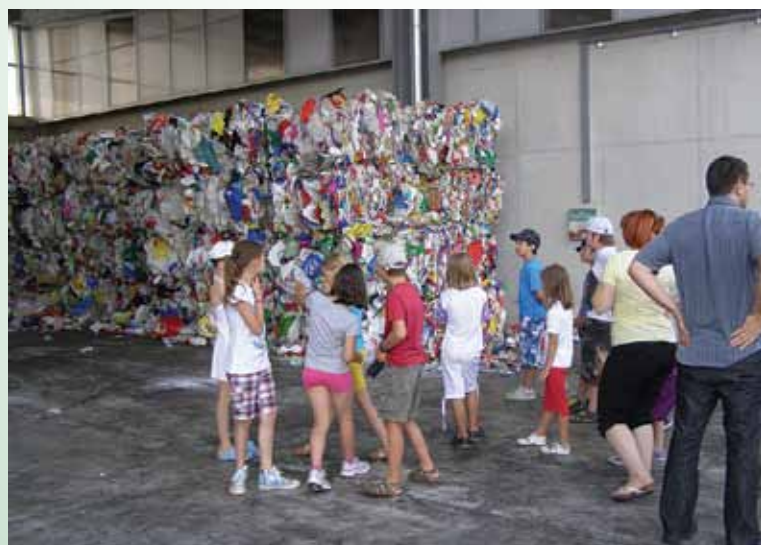
V Regijskem centru za ravnanje z odpadki v Celju so se mladi seznanili z obdelavo mešanih komunalnih odpadkov, kompostiranjem in sortiranjem ločeno zbranih frakcij.