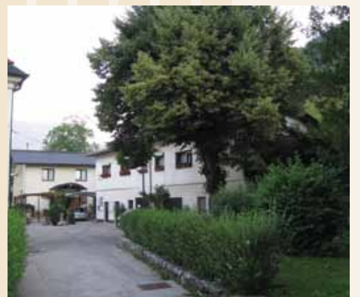
Sedež Rdečega križa v Laškem

faksa 734 34 61 , mobilnega telefona v delovnem času pa 041 736 166 . Naš e-naslov je: rdec.kriz.lasko@siol.net . Kandidati za bodoče voznike motornih vozil se lahko v tem času prijavite za tečaj prve pomoči, tisti, ki potrebujete pomoč, pa lahko prevzamete obrazec Prošnja za pomoč in uredite vse druge formalnosti, povezane z našo dejavnostjo. V tem času je odprta tudi oglasna agencija za NT in RC.