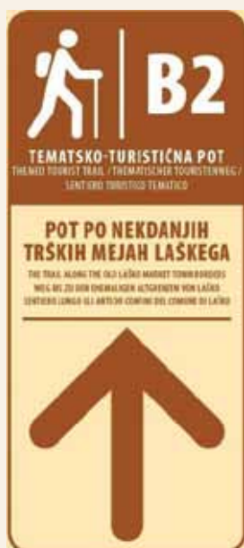
Oblika usmerjevalne table

Že do sedaj zelo priljubljena pohodna pot na levi strani reke Savinje se vije skozi naselja Laško, Tovsto, Ojstro, Padež, Trojno, Gabrno, Lahomšek, Lahomno in Marija Gradec. Povezuje več kulturnih znamenitosti, kot so graščina lilijskih – občinska stavba, trški Špital – hotel Savinja, mestni magistrat, laški dvorec Weichselbergerjev dvorec, cerkev sv. Martina, cerkev Matere božje s kapelicami v Marija Gradcu ... Zgodba poti obuja lep in star običaj, s katerim so tržani vsako leto v znamenje, da obhogeni prostor spada v njihovo last, obhodili meje trškega ozemlja. Običaj se je imenoval "objezdenje trga" (Burgfriedbereitung). Pot je dolga 11,2 km, najnižja točka poti je na 218 m, najvišja na 545 m, je srednje zahtevna, primerna za obisk v vseh letnih časih in za vse starostne skupine.