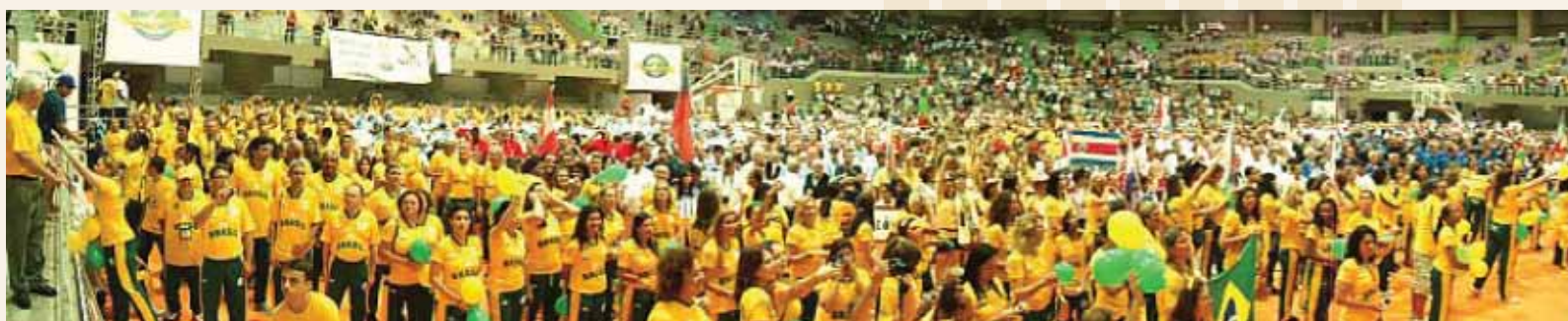
Otvoritvena slovesnost v dvorani Nélio Dias Gym, ki sprejme 10.000 gledalcev.