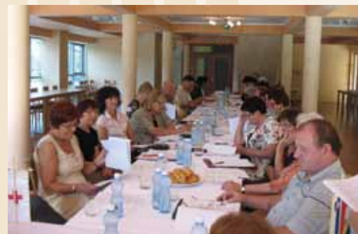
Iz zasedanja Skupščine v dvorani Aqua Roma Rimske Toplice

niti kadrovske podhranjenosti pri našem obsežnem delu, saj država letos skozi različne programe (javna dela, priložnost zame ipd.) namenja dostopnost in možnost zgolj premožnim organizacijam ter ambicioznim programom na drugih, manj eksistenčnih področjih. Dotaknili smo se tudi preveč enoličnih artiklov pomoči v hrani iz intervencijskih zalog EU. Zaključno poročilo je obravnaval tudi Odbor za družbene dejavnosti in društva pri Občinskem svetu Laško in podal dobro mnenje o delu RK Laško v preteklem letu.