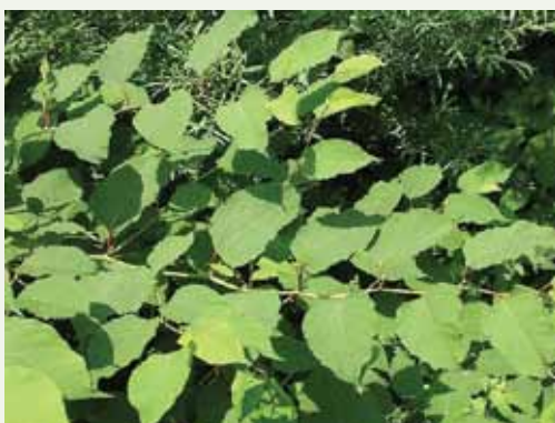
Listi japonskega dresnika so veliki 5 do 15 cm, steblo ni povsem ravno, ampak ima blago obliko cik-caka.

Zakaj smo za širitev krivi predvsem ljudje? Ker mu ustvarjamo rastišča in ker prenašamo delčke njegovih korenin. Ponevedoma ga raznašamo zlasti z enega gradbišča na drugega, z nasipavanjem in drugimi zemeljskimi deli. Prenašamo ga v materialih, ki jih prevažamo in nasipa-