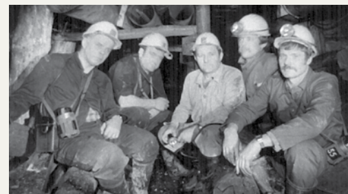
Rudarski »kumarati« pri delu

Poslej tudi v naših krajih. 11. aprila je 11 ustanovnih članov ustanovilo Rudarsko etnološko društvo Brezno-Huda Jama, od takrat pa upokojeni rudarji in druga zainteresirana javnost pridno izpolnjujejo pristopne izjave za vpis k temu društvu.