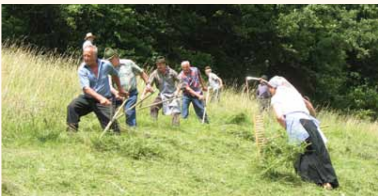
Lani so se nam na košnji v Trobnem Dolu pridružili tudi izkušeni kosci s častiljivimi leti.

Gre za spontano in sproščeno druženje s kosci in grabljicami iz kulturnih društev in skupin ter posamezniki ob čisto pravi košnji in spravilu krme na enem velikih in za delo zahtevnih travnikov v Šentrupertu. Ker v košnji sodeluje izjemno veliko koscev in grabljic, je pogled na družno delo, kakršnega danes vidimo le še malokdaj, res enkratno. Med sodelujočimi bo tudi letos nekaj prekaljenih koscev. Srečanje se bo pričelo v soboto, 23. junija, ob 15. uri, pri šoli v Šentrupertu, po opravljenem delu pa se bo zaključilo z druženjem na »likofu« in šegah ob kresnem večeru.