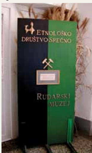
Napisna tabla muzeja