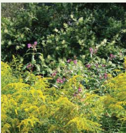
Japonski dresnik raste na opuščeni gradbiščih, ob cestah in železnicah. Najdemo ga tudi v družbi drugih invazivnih vrst, na primer zlate rozge in žlezave nedotike.