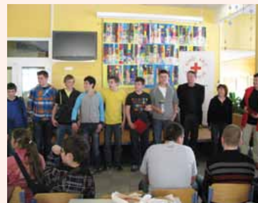
Ekipa tekmovalcev iz Rimskih Toplic se je uvrstila na odlično drugo mesto

Bili smo tudi organizatorji 6. regijskega tekmovanja osnovnošolskih ekip prve pomoči, ki je potekalo v Radečah. Iz območnih tekmovanj so se na regijsko uvrstile štiri ekipe, in sicer: iz OŠ Loče, OŠ Marjana Nemca Radeče, OŠ Štore in OŠ Šmarje pri Jelšah. Šestčlanske ekipe so se prav tako pomerile v zahtevnem teoretičnem znanju s pisanjem testa s področja prve pomoči, cestnoprometnih predpisov in Rdečega križa ter praktičnem reševanju ponesrečencev ob realističnem prikazu poškodb ob treh različnih situacijah, ki se lahko zgodijo v šoli, na poti v šolo ali na šolskem igrišču. Ekipe so pokazale dobro znanje, zato so si za svojo ustvarjalnost, veliko vnemo in prizadevnost na humanem področju prislužile priznanja