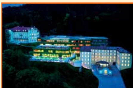
1. mesto v kategoriji najbolj urejeno podjetje v letu 2011 Rimske terme, d.o.o.