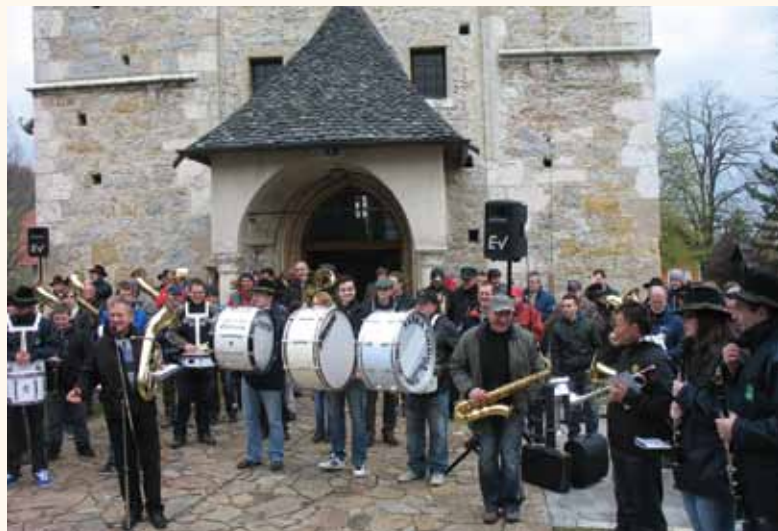
Pohodnike so pozdravili godbeniki iz kar petih godb.