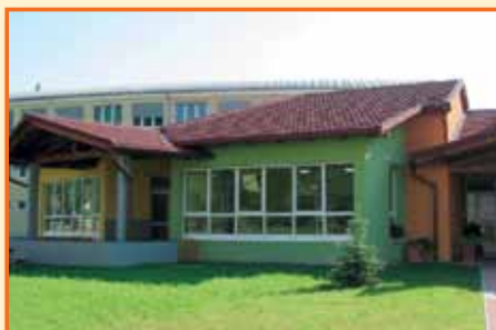
1. mesto v kategoriji najbolj urejen javni objekt v letu 2011 Vrtec Laško, enota Debro