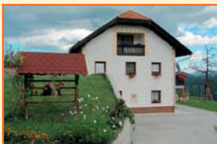
1. mesto v kategoriji najbolj urejena kmetija v letu 2011 družina Klepej, Laziše 1