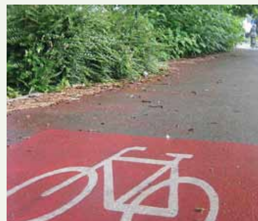
Zaradi hitre in bujne rasti japonski dresnik zmanjšuje varnost v prometu, saj ovira preglednost. V dveh mesecih je zasedel že polovico kolesarske steze pred križiščem.

Strokovnjaki so japonski dresnik uvrstili med »sto najhujših«. To je svetovni seznam invazivnih tujerodnih vrst, ki zunaj svoje domovine povzročajo največ težav. Zaradi gostih sestojev tu ne rastejo druge rastline, zato se zmanjša tudi število rastlinojedih žuželk. Tako je tu tudi manj žab, plazilcev, ptic in sesalcev, skratka, raznovrstnost živega sveta močno upade. Japonski dresnik izloča tudi posebne kemijske snovi, ki zavirajo rast prvotne združbe obrečnih rastlin. Na rastiščih ob vodi izpodrine vse druge rastline. Ko pozimi nadzemski deli odmrejo, tu ni drugih rastlin, ki bi vezale nabrežja in reka zato bregove pospešeno ruši in odnaša. Dresnik povzroča tudi poškodbe na vodnogospodarskih objektih, saj korenike prizadenejo njihove temelje.