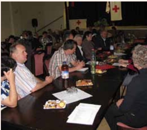
V Rečici se je kljub praznikom zbralo lepo število članov in gostov