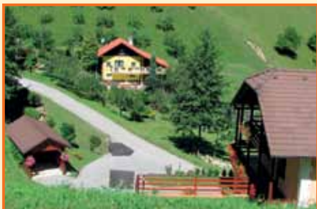
1. mesto v kategoriji najbolj urejena vas/zaselek/naselje/ulica v letu 2011 - Zaselek Jepihovec