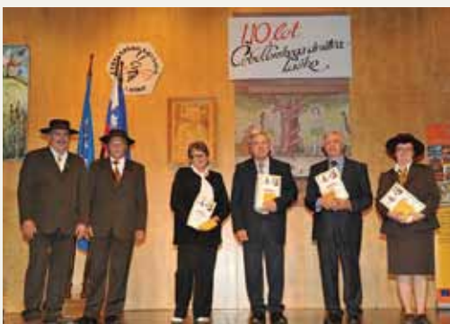
Prejemniki odličja Antona Janše II. stopnje