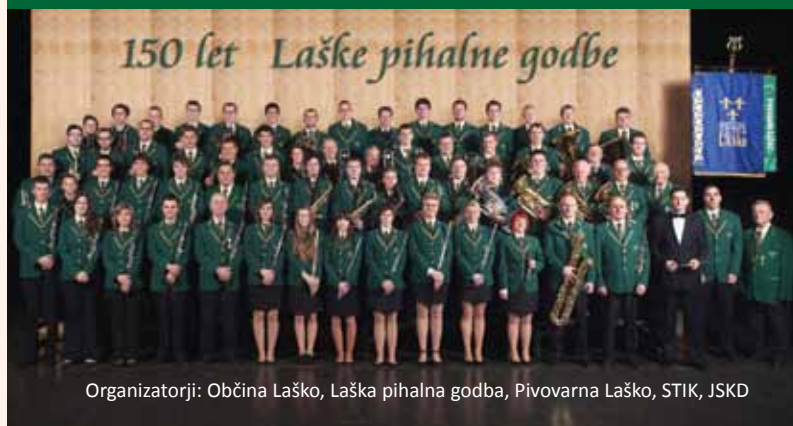
Organizatorji: Občina Laško, Laška pihalna godba, Pivovarna Laško, STIK, JSKD