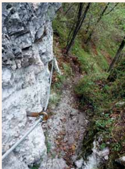
Varovanje z jeklenico

Že obstoječo in delno urejeno ter označeno pohodno pot je bilo treba očistiti (čiščenje zarasti, obrezovanje vej, odstranjevanje ovir na poti ...) in urediti zaščito proti eroziji (z nakopom poti, izkopom jarkov za odtok meteornih voda ter polaganjem lesenih erozijskih zaščit iz macesnovega in kostanjevega lesa, s katerimi se je utrdil oz. zaščitil zunanji rob poti). Za lažjo, predvsem pa bolj varno hojo tam, kjer obstaja nevarnost zdrsa, so se na najbolj strmih predelih poti uredile stopnice iz prečk in količkov iz macesnovega in kostanjevega lesa, na skalnih predelih pa so se uporabili jekleni pohodni klini. Najbolj nevarni odseki poti so se zavarovali z jeklenico.