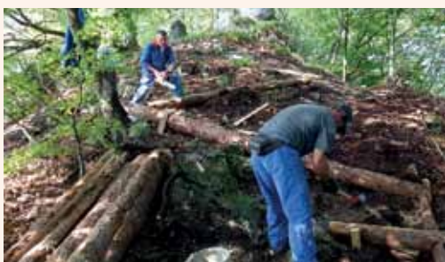
Člani PD Laško med delom