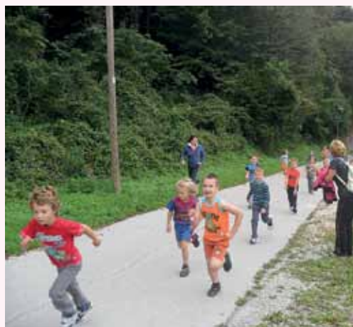
Prvošolci na prvem osnovnošolskem krosu