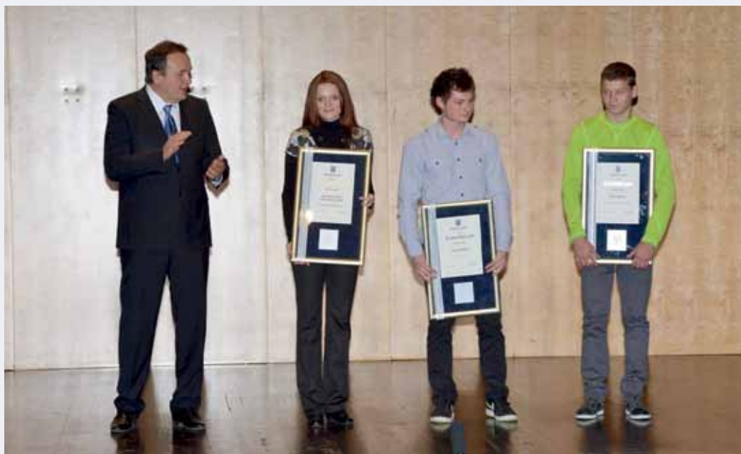
Prejemniki kristlanega grba.