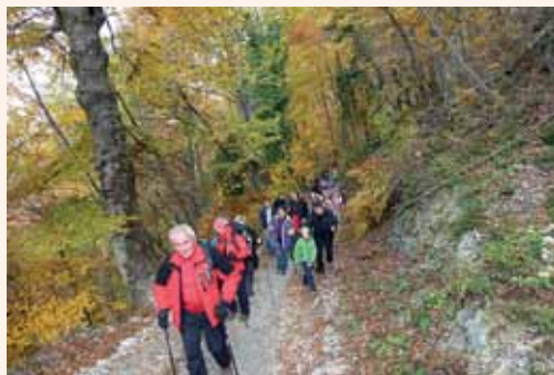
Kolona pohodnikov se je lepo raztegnila

Start pohoda s parkirišča pred TIC-em Laško so ob 9. uri naznanili strelji iz možnarja Vinka Križnika. Ob zvokih koračnice Laške pihalne godbe se je 250 pohodnikov podalo na 11,2 kilometra dolg obhod trških mej na levem bregu reke Savinje. Smer poti je glede na zapis iz leta 1769, ko so Laščani običaj praznovali zadnjikrat, iz objektivnih razlogov prirejena in poteka po trasi lani urejene in označene tematske poti B2 (zloženka Vandranje po Laškem in okolici – dosegljiva v TIC-u Laško).