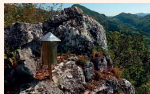
Posoda z vpisno knjigo na „Malem Humu“

V veliko veselje vsem ljubiteljem pohodništva smo oktobra zaključili dela, s katerimi smo uredili, označili (oznaka poti A7) in za kar dvakrat podaljšali obstoječo pot na Hum. Na poti, ki je zasnovana krožno, smo na novo uredili odsek, ki poteka od vrha Huma čez »tri vrhove« v Zahum, do Blaževe skale in po spodnji poti nazaj do izhodišča poti. Ob njej smo postavili klopi in koše za smeti, za lažjo in bolj varno hojo pa je del poti od vrha varovan z jeklenico, pohodnimi klini in lesenimi stopnicami.