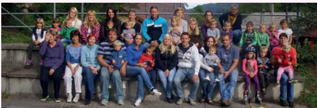
Druženje rečiških otrok in njihovih staršev

Na začetku novega šolskega leta smo se v petek, 13. septembra, srečali vsi, ki bomo skupaj korakali skozi šolsko leto 2013/14. Otroci iz vrtca in šole, starši ter delavci smo obujali spomine na pretekle počitniške dni in kovali načrte. Pobudo za druženje so dali starši v vrtcu in prijazno povabili tudi šolarje. V omenjenem popoldnevu je bilo mogoče slišati vesel živžav vse do mraka in tudi igrala so služila svojemu namenu: sproščeni igri, smehu in razgibavanju otrok.