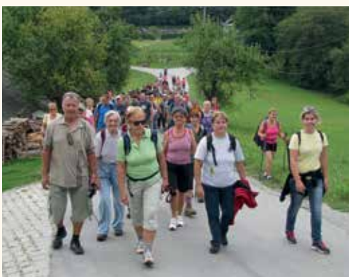
Še malo pa bomo na cilju letošnjega pohoda.

Prvi pohodniki, ki so se pričeli zbirati na parkirišču pred železniško postajo v Laškem, so nam dali slutiti, da bo tokrat udeležba številčnejša. Na koncu je bil naš cilj 100 udeležencev presežen, saj se ga je udeležilo kar 124 pohodnikov, kar je največ doslej. Vsi zbrani smo se, polni optimizma, veselja in sproščenega vzdušja, odpravili po poti spominov na Vrhovskega Anzeka, tokrat z okrepljeno skupino pohodnikov iz Svetine.