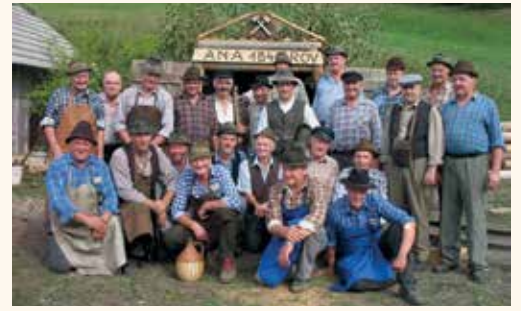
Delavci v »trobendolskem« rudniku so skrbno opravili svoje delo.