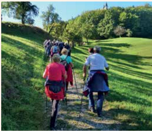
Na poti v smeri Šmihela

Druženje je postalo vedno bolj veselo in harmoniko je preglasila pesem. Ta je še posebej lepo zvenela v cerkvi sv. Krištofa.