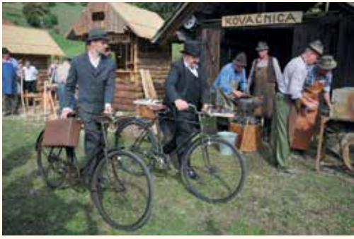
Lastnik in uradnik sta prišla med rudniške delavce in jim prinesla »colngo«.

li in se vživeli v svojo predstavitev. Od značilnega govora do samega dela in pri-