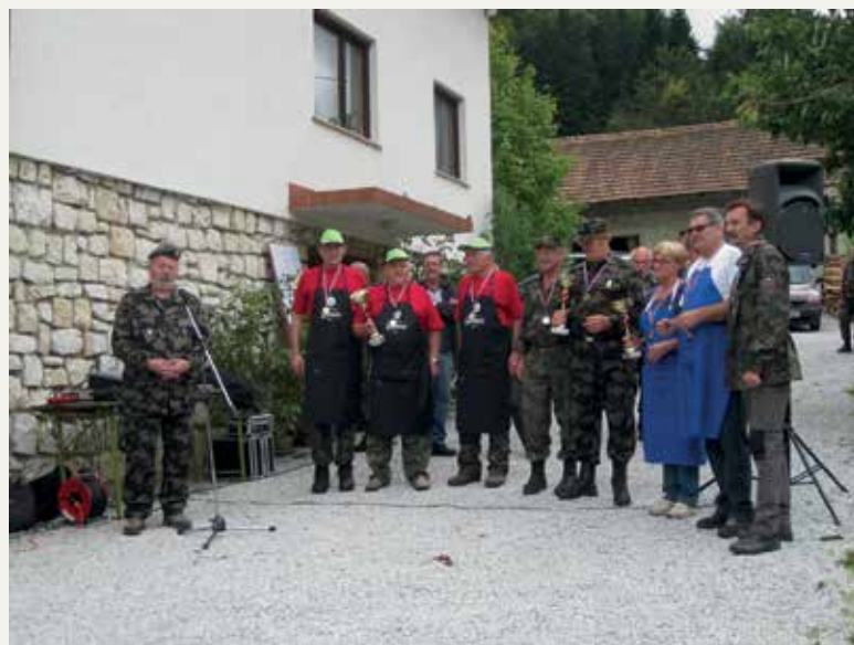
Prejemniki priznanj, ki so se najbolje odrezali pri kuhi pasulja.

21. septembra smo pri domačiji Jeran izpeljali strelsko tekmovanje v streljanju s polavtomatsko vojaško puško cal. 7.62 za III. pokal OZSČ Laško, katerega pokrovitelj je bilo Predsedstvo Zveze slovenskih častnikov Slovenije. Tekmovanja se je udeležilo 21 ekip Zveze slovenskih častnikov, Zveze veteranov voj-