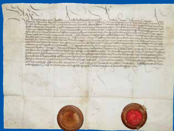
Privilegij št. 1 iz leta 1490 (prepis se nahaja v Muzeju Laško)

S privilegijem št. 1 iz leta 1490 je cesar Friderik potrdil trgu Laško pravico letnega sejma na Martinov dan, ki mu jo je podelil že neki prejšnji deželni knez, ker mu je zaradi vdora Turkov privilegijska listina zgorela in so pri tem tržani utrpeli veliko škodo.