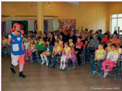
Tudi Pika Nogavička je navdušila najmlajše.

OŠ Primoža Trubarja Laško je s svojimi podružnicami z letošnjim šolskim letom pod svoje okrilje sprejela 108 prvošolcev – štirinajst PŠ Šentrupert, sedem PŠ Rečica, tri PŠ Vrh nad Laškim, medtem ko sta ostale sprejeli matična šola in debrska podružnica.