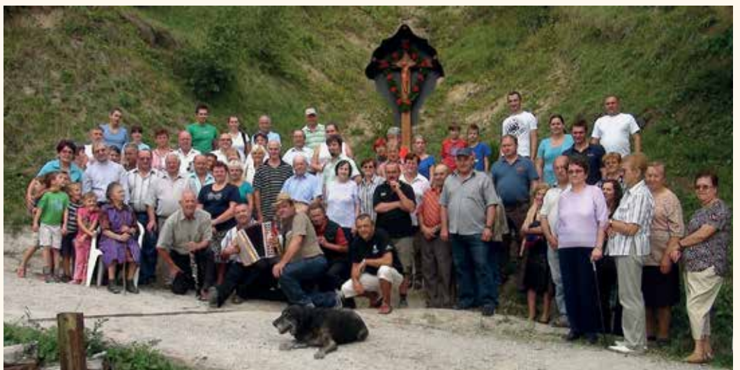
Zbrani ob novem križu v Gabrnem.