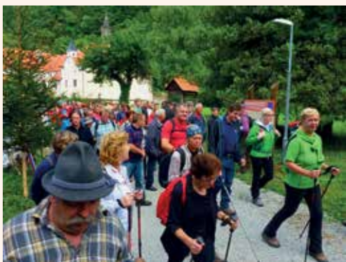
Start pohoda pri kartuziji