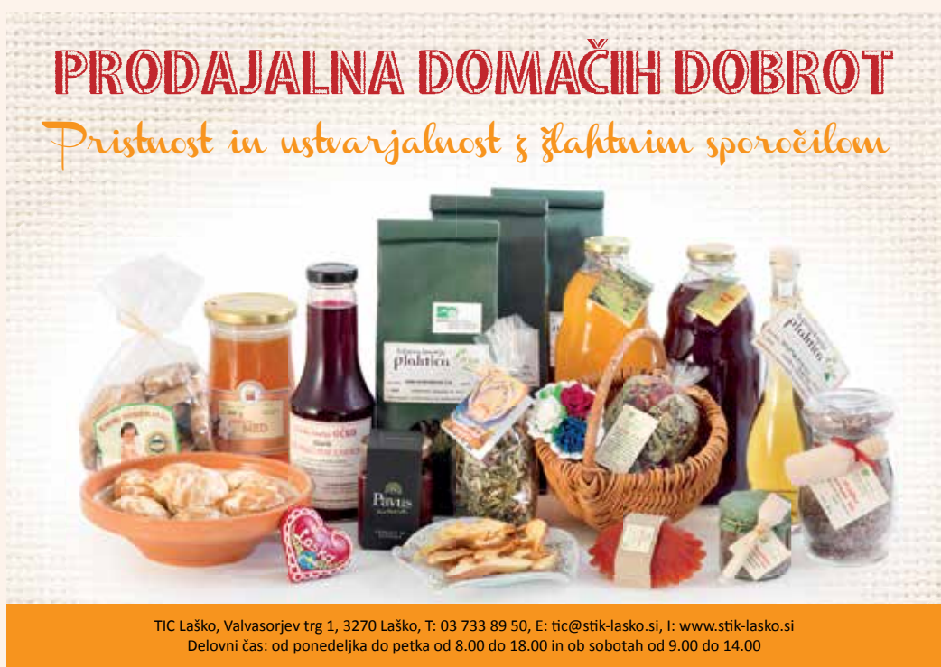
TIC Laško, Valvasorjev trg 1, 3270 Laško, T: 03 733 89 50, E: tic@stik-lasko.si, I: www.stik-lasko.si Delovni čas: od ponedeljka do petka od 8.00 do 18.00 in ob sobotah od 9.00 do 14.00

Med 11. in 17. septembrom se je na Celjskem sejmu odvijal MOS 2013, nedvomno največja sejemska in poslovna prireditev v Sloveniji. Na sejmu z dolgoletno tradicijo se vsako leto zbere veliko razstavljalcev, ki predstavljajo nove produkte in razvoj na različnih področjih ter tudi veliko število obiskovalcev. Ti so imeli priložnost spoznati tudi turistično ponudbo Laškega ter ostalih 21 občin Savinjske regije, združenih v destinacijo Dežela Celjska . Doživetja in okusi Dežele Celjske so bili predzadnji konec tedna v septembru predstavljeni še na 5. mednarodnem festivalu sladk in sladkih izdelkov Sladka Istra v mestu Koper. Festival je predstavljal pestro izbiro različ-