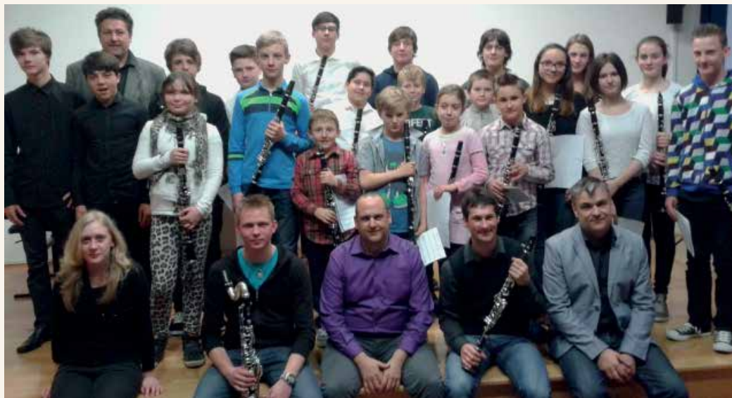
Delavnica za učence klarineta, dvorana glasbene šole v Laškem.

bene šole Krško. Rezultat celodnevne dela v komornih skupinah je bil zaključni nastop za starše, kjer so poleg učencev zaigrali tudi učitelji. Ob tej priložnosti se zahvaljujemo različnim donatorjem, domačinom, ki pripomorejo h kvalitetnejši izvedbi naše dejavnosti.