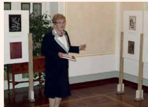
Resnična umetnost je dobra in rodovitna zemlja, ki omogoča rast semen dobrote in ljubezni.