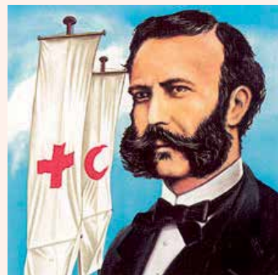
Henry Dunant, ustanovitelj RK in velik človek za boljši svet.

V teh dneh že zbiramo informacije o vsem, kar bo letos znamenovalo omenjeni mesec dejavnosti. Po napovedih sodeč jih bo veliko, bodo privlačne in zanimive, zato ste še posebej vsi člani prisrčno vabljeni, da se jih udeležujete.