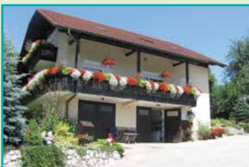
1. mesto v kategoriji najbolj urejena kmetija v letu 2013 družina Božič - Peklar, Belovo 4, Sedraž