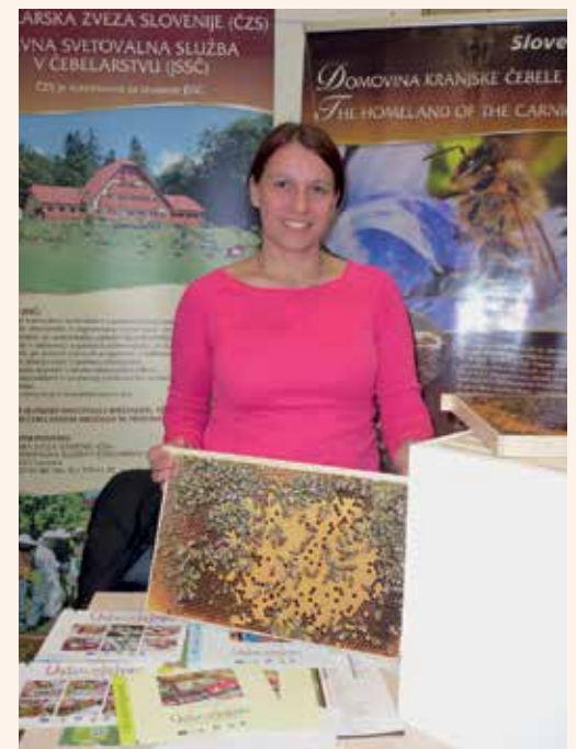
»Učimo se pri čebelah«, razstavní prostor ČZS

V kontekstu letošnjega Mednarodnega leta družinskega kmetovanja je v okviru Kulturnega bazara potekala tudi tematska razprava Čebelarstvo in kultura: Učimo se pri čebelah, saj čebelarstvo, poezija kmetijstva, v Sloveniji predstavlja pomembno naravno in kulturno dediščino, hkrati pa družinsko tradicijo, ki se prenaša iz roda v rod. Ob tem je bila posebej poudarjena neprecenljiva vloga šolskih čebelarskih krožkov in njihovih mentorjev - čebelarjev (v občini Laško ČD Laško izvaja kar 5 čebelarskih krožkov za različne starostne skupine na