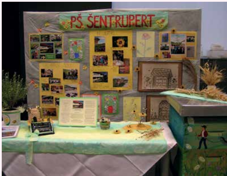
Naša stojnica na Celjskem sejmu.

Naše delo so obiskovalci pohvalili, več pedagoških delavcev si je naš pristop k delu vzelo za zgled in bodo skušali iti po naših