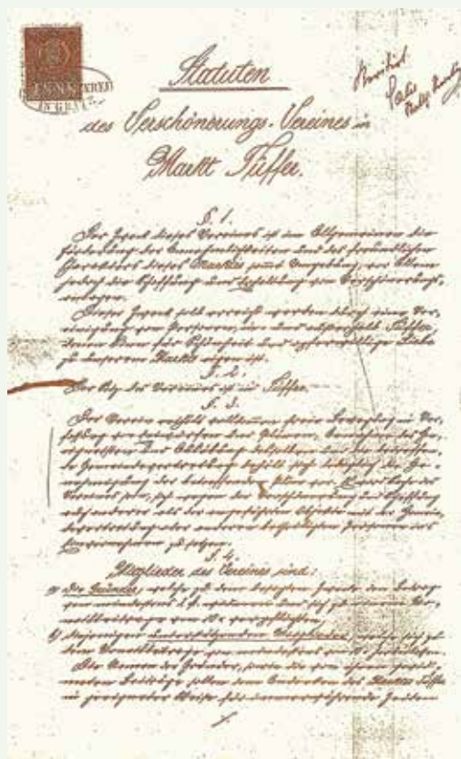
Prva stran statuta Olepševalnega društva v trgu Laško (Foto: Muzej Laško).