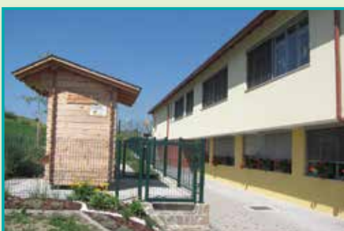
1. mesto v kategoriji najbolj urejen javni objekt/podjetje v letu 2013 Osnovna šola Primoža Trubarja Laško, podružnična šola Šentrupert, Šentrupert 89