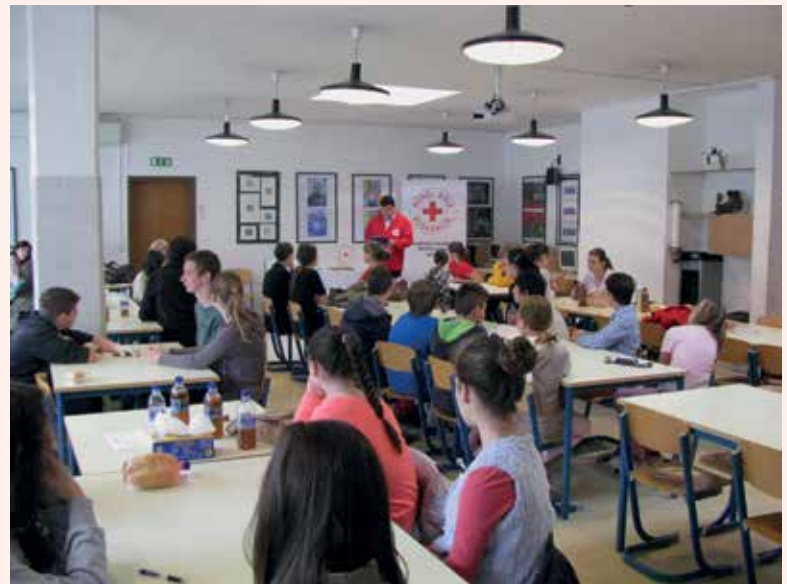
Priprave na tekmovanje.

Tudi letos se ekipe učencev osnovnih šol laške in radeške občine že vneto pripravljajo na tekmovanje v znanju iz prve pomoči. Državno tekmovanje razpisuje Rdeči križ Slovenije na podlagi dogovora z Ministrstvom za izobraževanje, znanost, in šport, v okviru Evropske listine o varnosti v cestnem prometu, katere podpisnik je tudi Rdeči križ. 7. območno tekmovanje je na podlagi državnega razpisa razpisalo Območno združenje Rdečega križa Laško. Veseli nas dejstvo, da se je tokrat za tekmovanje odločilo in prijavilo doslej največje število ekip, in sicer kar osem iz vseh centralnih šol laške in radeške občine. Tekmovanje je potekalo 12. aprila na Osnovni šoli Primoža Trubarja Laško. O rezultatih in uvrstitvah naših tekmovalcev na regijsko in morebiti na državno tekmovanje vas bomo seznanili v naslednji številki biltena.