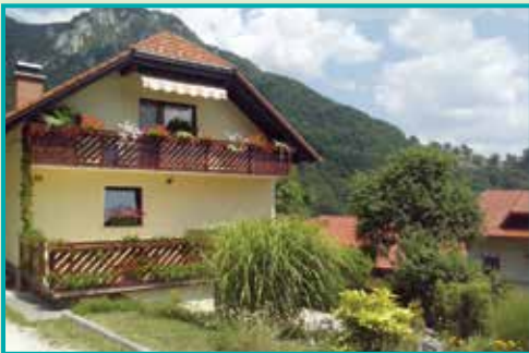
1. mesto v kategoriji najbolj urejena vas/zaselek/naselje/ulica v letu 2013 - zaselek Veliko Širje, Zidani Most