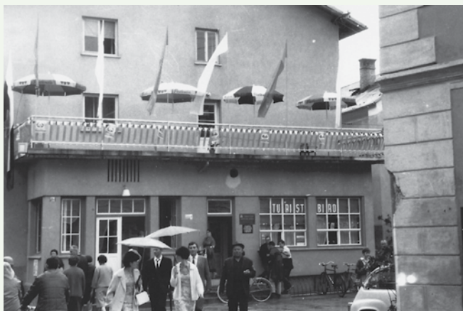
Prostori Turističnega društva v nekdanji Savinji leta 1964.

zapisal: »Laško ima od zadnjega poletja svoje olepševalno društvo, ki ga resnično potrebuje, kajti v našem lepem kraju je treba marsikaj pospraviti ...«