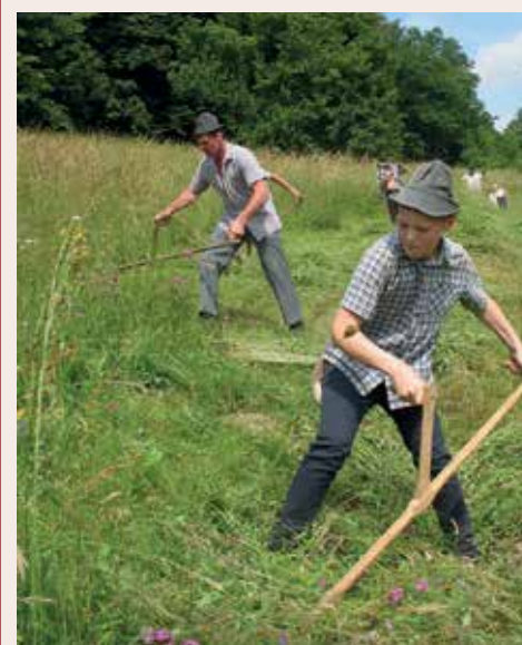
Šentrupertčani na 4. košnji v Mali Brezi, leta 2013