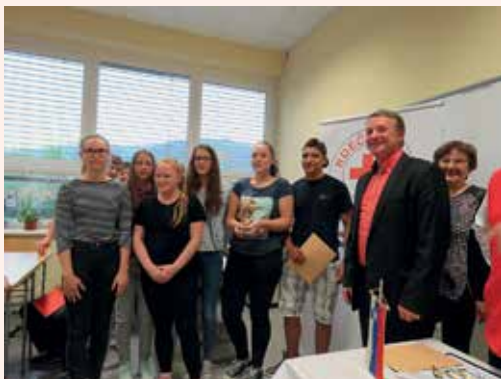
Ekipi iz OŠ Antona Aškercia Rimske Toplice za las ušlo prvo mesto.

le za dve točki, s tem, da je za razglasitev drugega mesta štel večje število doseženih točk v praktičnem delu.