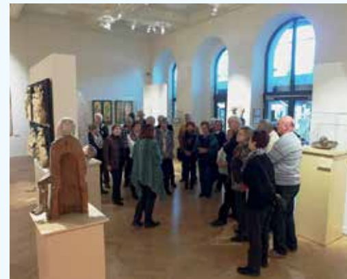
Ogled Narodne galerije v Ljubljani