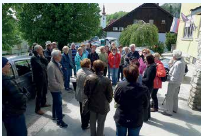
Člani domoznanskega in popotniškega krožka na Planini pri Sevnici