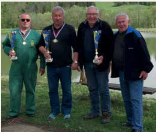
Vodje zmagovalnih ekip RD Laško, RD Maribor in RD Novo mesto ter predsednik RD Laško.

Rad bi se zahvalil vsem svojim zvestim sodelavcem, pa tudi vsem, ki so kakorkoli pomagali. Po okusnem kosilu, ki nam ga je pripravil najemnik na ribiškem domu Marof, je sledila razglasitev rezultatov ter podelitev pokalov in medalj. Po razglasitvi se je končalo še eno državno prvenstvo ter druženje ribičev, ki smo si ob slovesu zaželeli dobrega prijema v naslednjih tekmah in ponovnega snidenja tudi v prihodnjem letu.