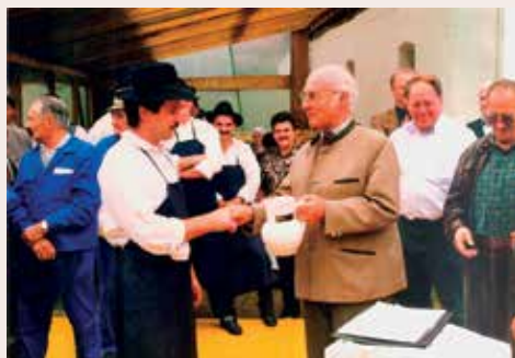
Nagrada za drugo mesto na tekmovanju mlatičev s cepci v Neukirchnu v Zgornji Avstriji, 1995.