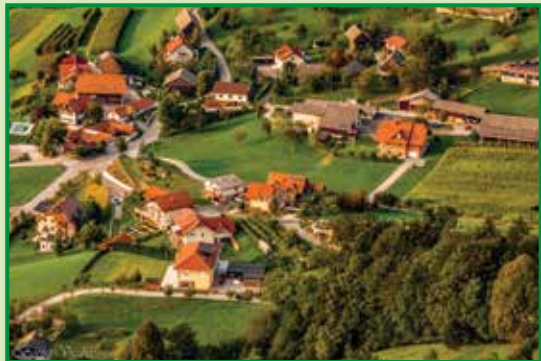
1. mesto v kategoriji najbolj urejena vas/zaselek/naselje/ulica v letu 2016 zaselek Jagoče – po domače "Seliše"