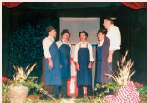
Ljudski pevci na gostovanju v Šmartnem v Rožni dolini, 2001

iz Šentruperta leta 1995 udeležila mednarodnega tekmovanja mlatičev s cepci v Neukirchnu v Zgornji Avstriji, zastopala Slovenijo in v močni konkurenci