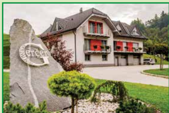
1. mesto v kategoriji najbolj urejen javni objekt/podjetje v letu 2016 Sašo Gerčer, s.p., Belovo 4a