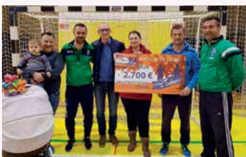
Predaja čeka NK Pivovar Laško