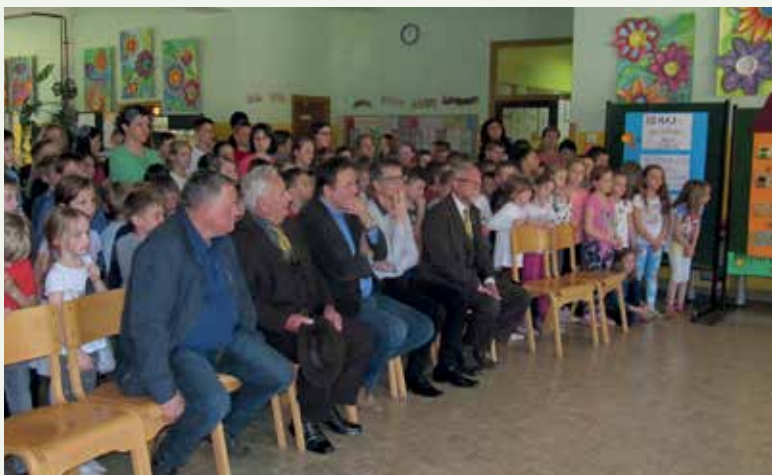
Avla OŠ Primoža Trubarja Laško

V prejšnjem biltenu je bilo precej napisanega o natečaju ČZS za poslikavo panjskih končnic in namenu predstavitve v okviru »ODPRTEGA DNEVA ČEBELARJEV«. Na natečaj so svoje poslikave prijavi OŠ PT Laško in OŠ AA Rimske Toplice. Predstavitve poslikav so bile organizirane v sodelovanju s čebelarji na posameznih šolah v sklopu dogodka »ODPRTI DAN ČEBELARJEV«.