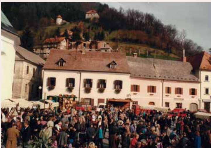
Že na prvem Martinovem v Laškem je bilo živahno. november, 1996