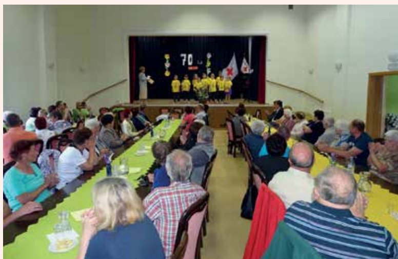
Na zboru članov se je ob obeleževanju 70-letnice delovanja zbralo lepo število obiskovalcev.

Organizacija krvodajalske akcije, pomoč v hrani in šolskih potrebščinah, letovanje otrok in starejših na Debelem rtiču, pomoč pri plačilu položnic in pomoč ob nesrečah, organizacija ekskurzij za članstvo, organizacija srečanj starejših in krvodajalcev, obiskovanje starejših ob koncu leta, spodbujanje in podpiranje akcije »Za zdrave zobe«, akcije »Peljimo jih na morje« je le nekaj nalog v okviru naše organizacije, ki jih izvajamo vsako leto. V zadnjih desetih letih je iz naše KS brezplačno letovalo 29