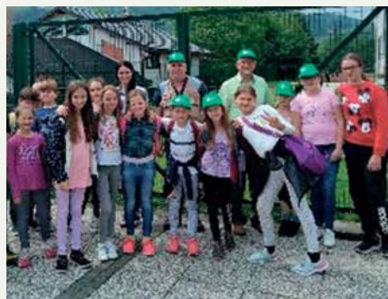
Mladi čebelarji z mentorji v Krškem