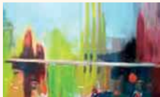
Čebele v svetu ...