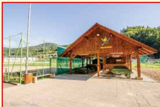
1. mesto v kategoriji najbolj urejen javni objekt/podjetje v letu 2017 Športno društvo Rečica, Huda Jama 1