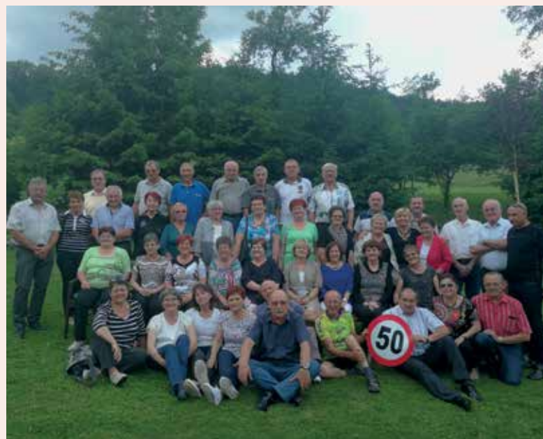
Nasvidenje do naslednjic!