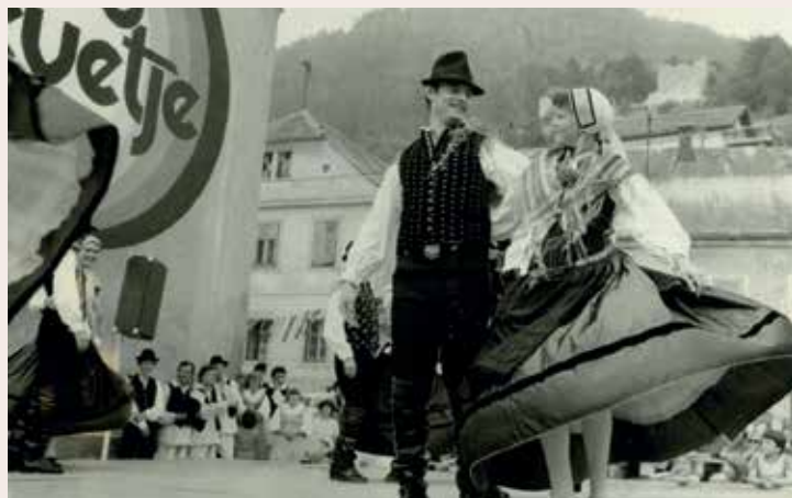
TD Laško je 49 let pripravljalo prireditev Pivo in cvetje. Iz nastopa Akademске folklorne skupine France Marolt, leto 1980.