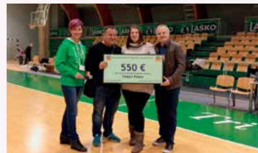
Prispevek KK Zlatorog Laško

jo največ pripomogla k popolni izvedbi teka. Na dobrodelnem teku se je zbralo kar 2700€ prostovoljnih prispevkov. Za Tinkarino zdravje pa je pomagal tudi domači KK Zlatorog Laško. Na domači tekmi 14. 11. 2017 so od prodaje kart in rekvizitov KK Zlatorog ter z zbiranjem prostovoljnih prispevkov zbrali 550€.