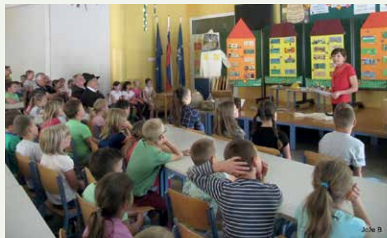
Avla OŠ Primoža Trubarja - PŠ Debro

Tretji dogodek v okviru odprtega dneva čebelarjev je bil v avli OŠ Primoža Trubarja - podružnice Debro 11. 5. Učenci 5. a razreda so pod mentorstvom Irene Plevnik predstavili 16 panjskih končnic.