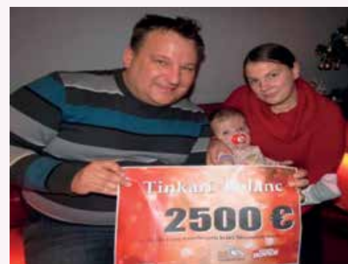
Prispevki Krambergerjevega sklada

Denarna sredstva smo prejeli tudi od Krambergerjevega sklada v višini 2500€,