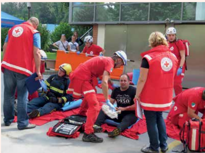
Poškodovanci pri kotlovnici Thermane Laško.

Po besedah vodstva tekmovanja je bilo to eno boljše organiziranih tekmovanj. Vse je potekalo brez kakršnih koli težav, tako iz strokovnega kakor organizacijskega vidika. Zato smo prejeli tudi kar nekaj pohval samih udeležencev tekmovanja in prisotnih gostov. Iz tega razloga smo se pri Območnem združenju Rdečega križa Laško-Radeče odločili, da spominske skulpture v znak uspešnega sodelovanja in zahvale podelimo soorgani-