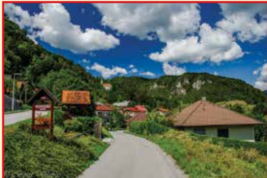
1. mesto v kategoriji najbolj urejena vas/zaselek/naselje/ulica v letu 2017 Trsteniška ulica, Rimske Toplice