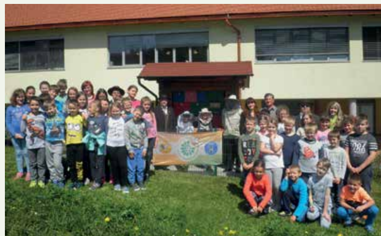
OŠ Primoža Trubarja - PŠ Šentrupert