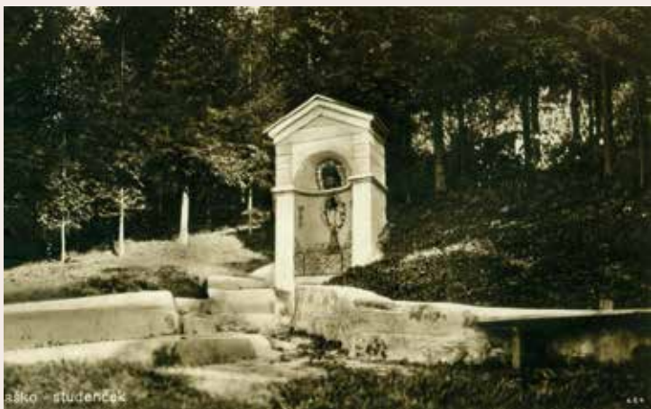
Žegnani studenec v Jagočah s pomenljivo zgodbo Foto: Arhiv TD Laško, razglednica iz obdobja med obema vojnama.

Turistično društvo Laško že od njegove ustanovitve odlikuje tesno sodelovanje z nekaterimi drugimi lokalnimi društvi. V povezovanju z njimi vidijo prihodnost in zato z njihovim sodelovanjem uresničujejo projekt »Laško, naše mesto« kot vzoren primer skupnega delovanja, v dobro kraja, v katerem delujejo. Pri društvu so skozi obdobje delovanja izdali vrsto različnih prospektov, kart mesta in občine, prav tako pa tudi brošure ob njihovih obletnicah.