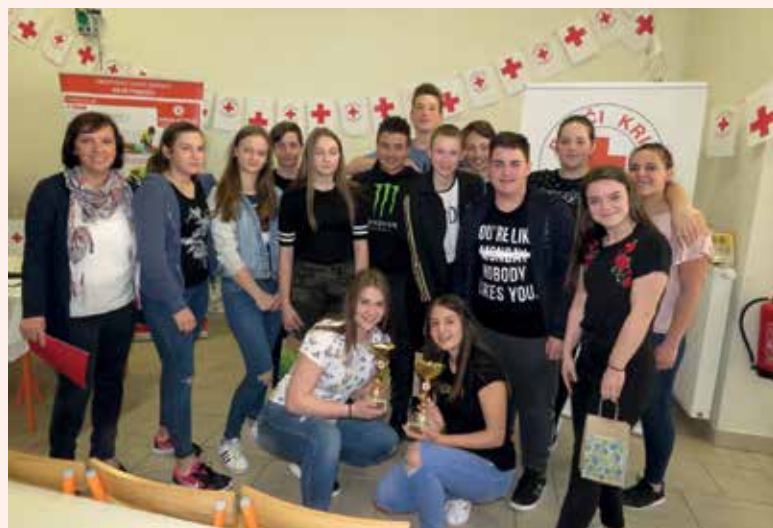
Ekipe OŠ Antona Aškerc Rimske Toplice s pokaloma za osvojeni prvi dve mesti.