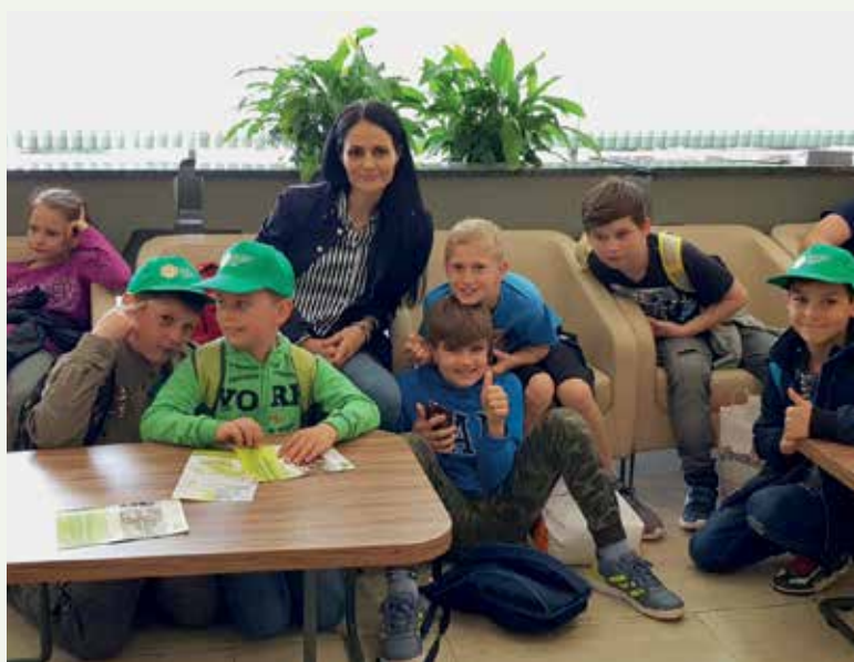
Ekipa OŠ Primoža Trubarja Laško v Krškem