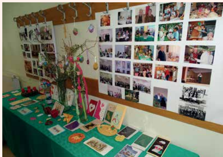
V Sindikalnem domu so ob jubileju pripravili priložnostno razstavo.

V času pred velikonočnimi prazniki in v predadventnem času organiziramo delavnice, na katerih izdelujemo suho cvetje, voščilnice, butare, adventne sveče in aranžmaje ter še marsikaj. S prispevki od izdelkov pomagamo učencem pri doplačilu šolskih potrebščin in za druge pomoči, kadar je potrebno pomagati. Ob tem se zahvaljujemo za pomoč vsem donatorjem, ki nam stojite ob strani in našim članom ter vsem, ki nam pri izvedbi naših programov pomagajte, tako in drugače.