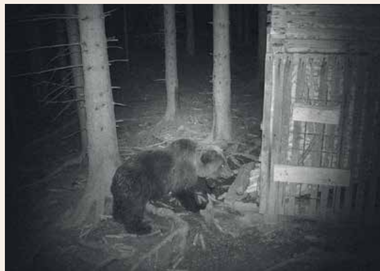
Posnetek medveda na krmišču za divje prašiče (Vir: ZGS, OE Celje).

V kolikor bi medved povzročil kakršnokoli škodo na premoženju ljudi, je potrebno podati prijavo na Zavod za gozdove Slovenije, Območna enota Celje, Ljubljanska 13 3000 Celje, tel. (03) 42 55 180. Ker je rjavi medved zavarovana živalska vrsta, odškodnino za nastalo škodo povrne Republika Slovenija, oce- ni pa jo pooblaščenec Ministrstva za okolje in prostor na ZGS, OE Celje.