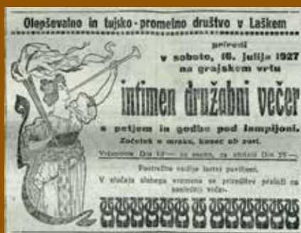
Nova doba, Celje, 1927

Lanskoletna prireditve »Matejev sejem 1927 – prikaz življenja v mestu in prihod kralja Aleksandra I.« ob 90-letnici pridobitve mestnih pravic je bila med vami dobro sprejeta. Organizatorji smo se zato odločili, da bomo prireditve ponovili in nadgradili, zato tudi v letošnjem letu nadaljujemo z raziskovanjem življenja v Laškem med obema vojnoma. Veliko informacij smo pridobili iz pogovorov, pa tudi časopisov, ki so izhajali v tem obdobju. Največ zanimivih informacij smo našli v celjskem časopisu Nova doba. Iz reklamnih oglasov lahko vidimo, kako živahna je bila prodaja konfekcije, metražnega blaga, nakita, obutve in tudi, kakšne frizure so bile v modi, katere plesne so se učili in plesali (in katere skladbe so bile popularne), kaj so hodili gledati v kino in kakšno je bilo družabno življenje.