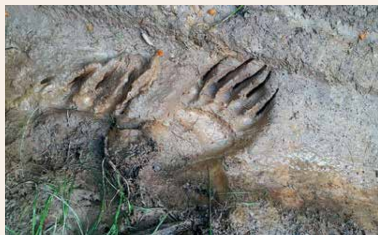
Odtisi šap medveda v blatu (Vir: ZGS, OE Celje).