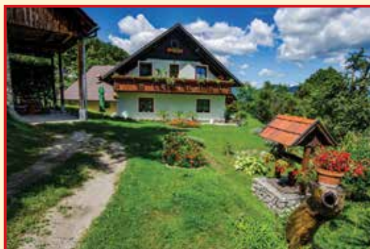
1. mesto v kategoriji najbolj urejena kmetija v letu 2017 Kmetija Cajzek, Senožete 5