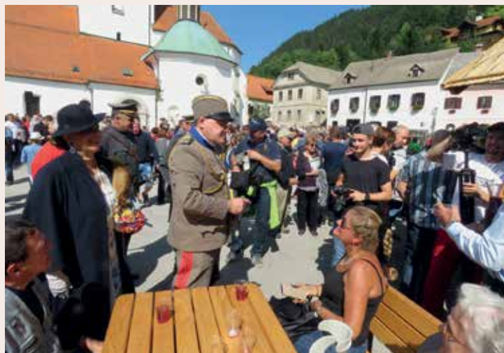
Iz Matejevega oz. Matevževega sejma ob obletnicah mesta septembra 2017

Pripravila Vlado Marot in Srečko Maček