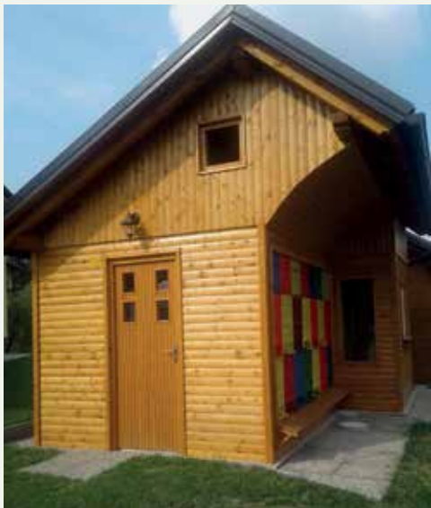
Novi čebelnjak na Marofu

V Laškem je bilo poslikanih 51 panjskih končnic. Nekaj jih je že pritrjenih na panje, nekaj jih na panojih krasijo avle šol, del pa bo prikazan ob različnih priložnostih. ČZS je lani objavila natečaj zato, ker je leto 2018 leto kulturne dediščine. Panjske končnice predstavljajo posebnost slovenske dediščine. Natečaj je bil zaključen 20. 4. na »DAN ODPRTIH VRAT ČEBELARJEV«.