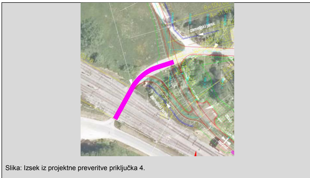
Slika: Izsek iz projektne preveritve priključka 4.