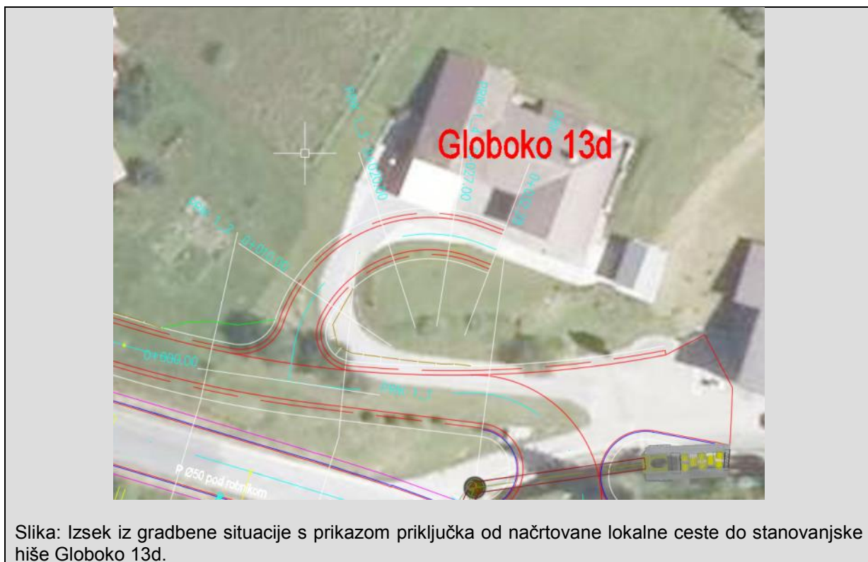
Slika: Izsek iz gradbene situacije s prikazom priključka od načrtovane lokalne ceste do stanovanjske hiše Globoko 13d.

Predno podam kakršno koli mnenje zahtevam na osnovi zagotovljenih ustavnih pravic in ostalih upravnih postopkov ob pridobivanju in dokumentiranju predvidene gradnje sem primoran, da od vas zahtevam temeljit in jasen odgovor, idejni načrt s podpisom projektanta z vrisano končno traso glavne ceste in njenimi priključki, ter zemljiško knjižno situacijo v kateri bo vrisana na vseh prizadetih parcelah trase glavne ceste z varovalnimi pasovi to pomeni, da se vse nevarnosti povečajo za 100% in tako od plinov, prahu, smradu in ropota bova deležna 24h na dan za vse večne čase, ne smemo pa pozabiti na vrednost naše hiše, ki se bo zmanjšala najmanj od 40-50% in temu se bo vsak izogibal, da kupi takšno hišo. Zdravje in čisto okolje je zdaleč nad interesi kapitala, zato se obračava na vas za podrobna pojasnila ob vseh teh neprijetnostih in okoljskimi parametri glede na povzročeno onesnaženost z povečanjem vseh koncentracij, kot so hrup, plini, elektromagnetno sevanje, pasivni delci itd. Do sedaj nisva bila pismeno seznanjena, niti pridobila v pogled oz. seznanitev dokumentacije, ki bi nama dokazala in garantirala, da se življenjsko in bivalno okolje ne bo poslabšalo in da bodo vplivi vseh novogradenj pozitivno vplivali na bivalno okolje, predhodno navedenih dejavnikov vpliva na okolje bivanja.