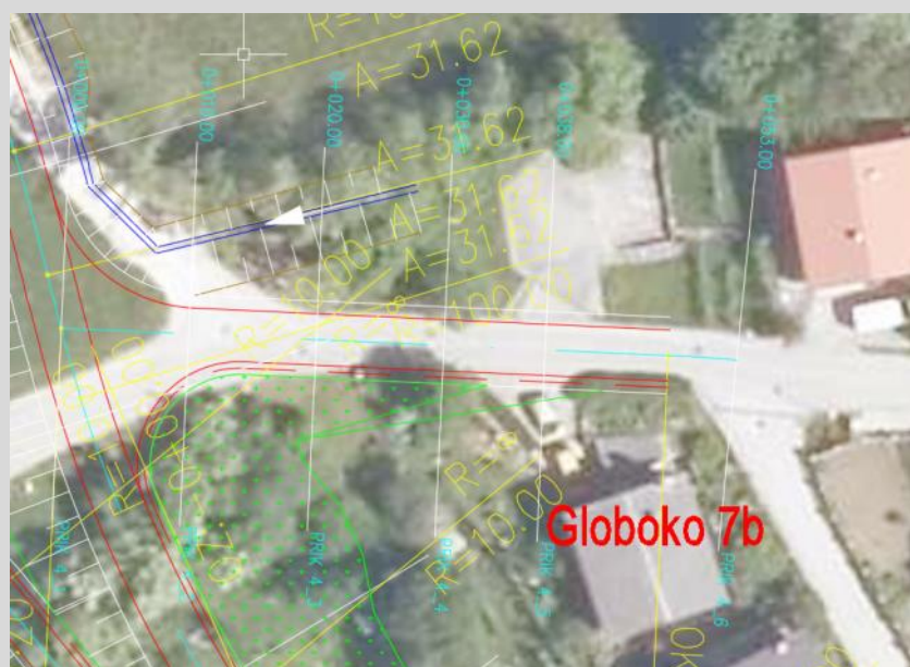
Slika: Izsek iz gradbene situacije s prikazom načrtovane lokalne ceste mimo stanovanjske hiše Globoko 7b.

V fazi priprave OPPN je bilo izdelano okoljsko poročilo, v sklopu katerega so bili obravnavani vpliv izvedbe OPPN na obremenitev okolja in prebivalcev z emisijami v zrak in s stališča varstva pred hrupom. Ugotovljeno je bilo, da bodo ureditve regionalne in lokalnih cest glede na projekcije prometa povzročile minimalno povečanje prometa na obravnavanih cestah. Slednje pomeni, da bodo vplivi na zdravje ljudi z vidika hrupne obremenjenosti in kakovosti zraka zanemarljivo majhne. Obstoječa kvaliteta bivanja se z izvedbo OPPN tako ne bo spremenila.