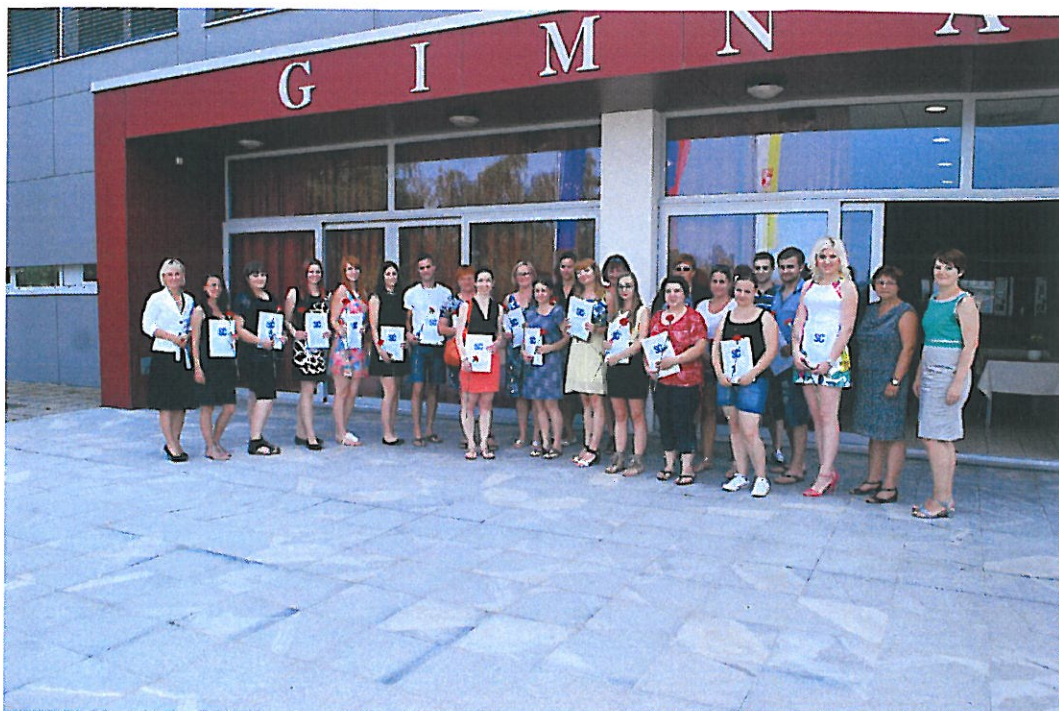
Podelitev spričevali zaključnih izpitov in poklicne mature 2015