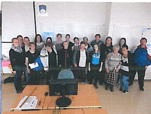
Računalništvo z varovanci VDC-ja