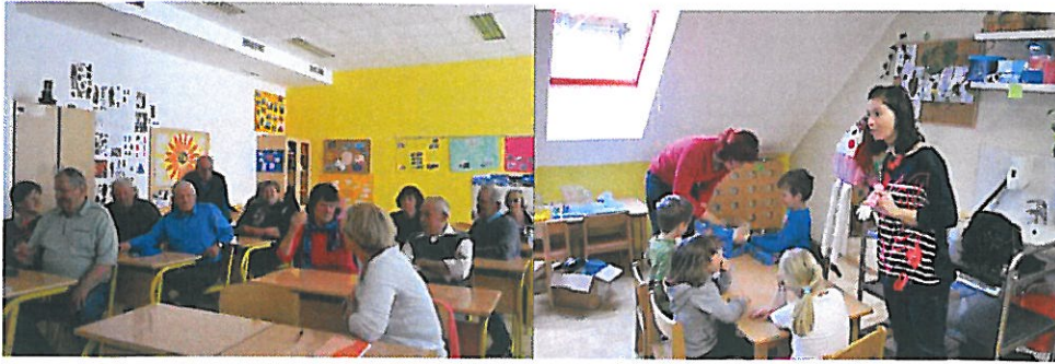
Predavanje varno z avtom na cesti