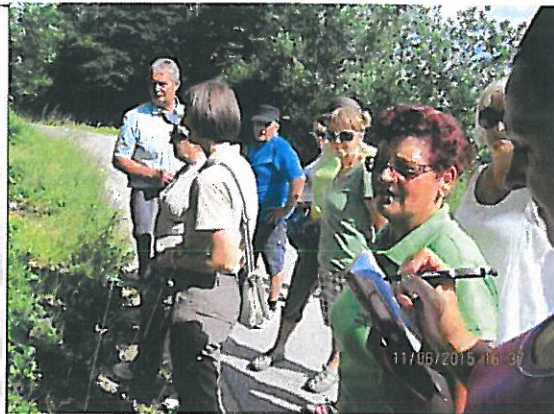
Člani zeliščarskega krožka so zelo aktivni