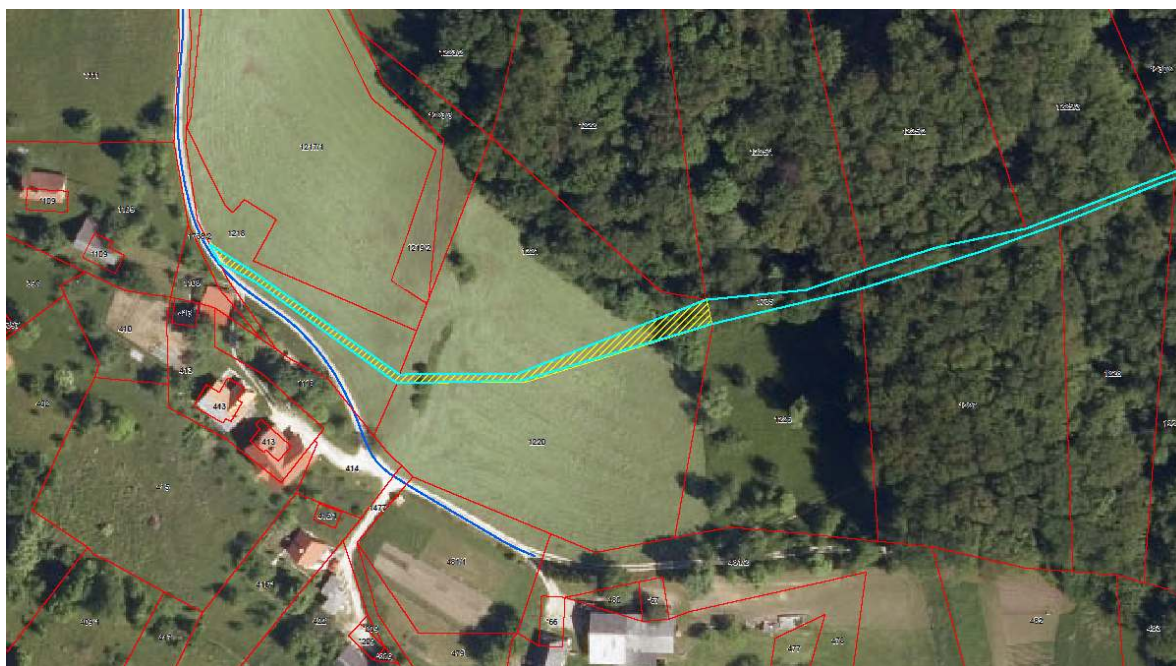
Slika 3: Zemljišče s parc. št. 1735, k.o. Sedraž