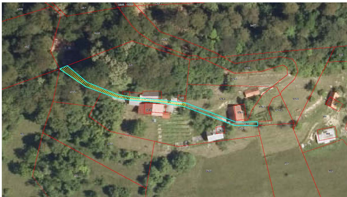
Slika 2: Zemljišče s parc. št. 1360, k.o. Šmihel

Zemljišča parc. št. 1735, k.o. Sedraž, 1360, k.o. Šmihel in 747/1, k.o. Lokavec, prav tako predstavljajo del opuščeni javnih poti, ki že vrsto let ne opravljajo funkcije poti. Po predhodni odmeri predmetnih parcel se bodo zemljišča zamenjala za parcele, ki predstavljajo del kategoriziranih cest in so v lasti fizičnih oseb.