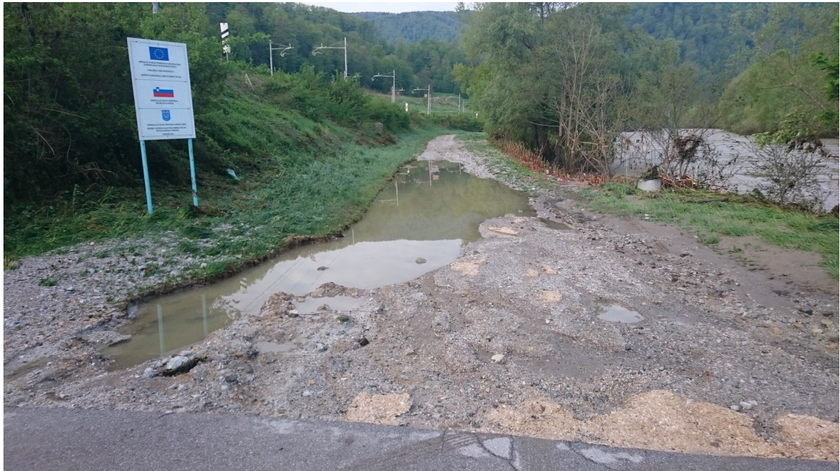
Slika 3: Uničena javna pot Radoblje – Železniška postaja Rimske Toplice