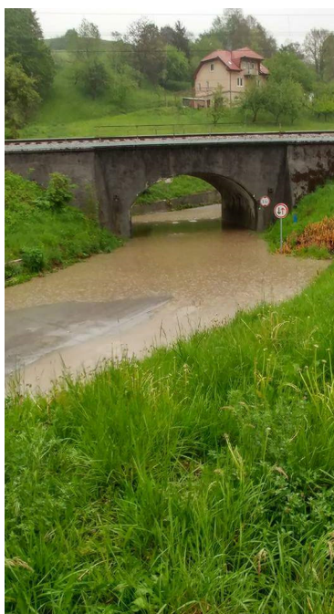
Slika 1: Podvoz Marija Gradec

Laško je bilo prometno nedostopno iz vseh strani (po glavni cesti je tekla Savinja). Nепrevozne so bile ceste proti Celju, Rimskim Toplicam, Marija Gradcu in Jurkloštru.