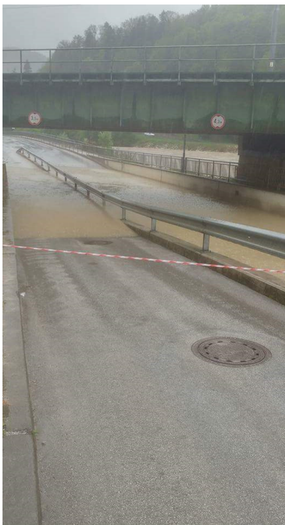
Slika 2: Neprevozen podvoz na regionalni cesti v smeri Laško – Marija Gradec