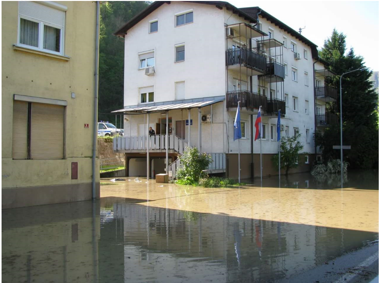
Slika 4: Poplavljeni prostori Policijske postaje Laško