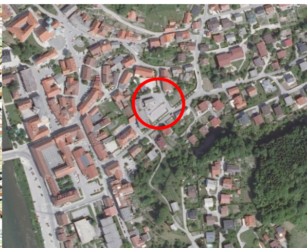
Slika 6: širši prikaz v prostoru – digitalni ortofoto posnetek