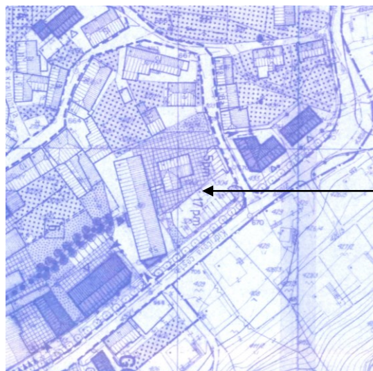
Slika 2: Izsek iz UN