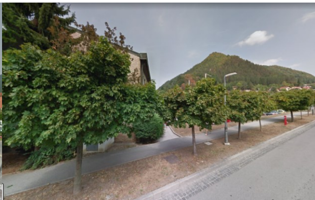
Slika 8: pogled na območje z juga