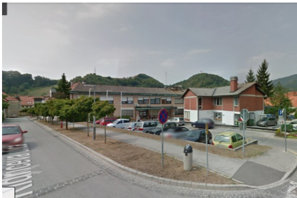
Slika 7: pogled na območje z jugovzhodne smeri