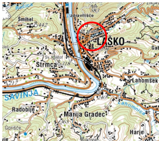
Slika 5: širši prikaz v prostoru – topografija

Preko območja SD UN poteka nizkonapetostno elektroenergetsko omrežje in komunikacijsko omrežje ter interni vodi (priključki) javnega vodovoda, fekalne in meteorne kanalizacije.