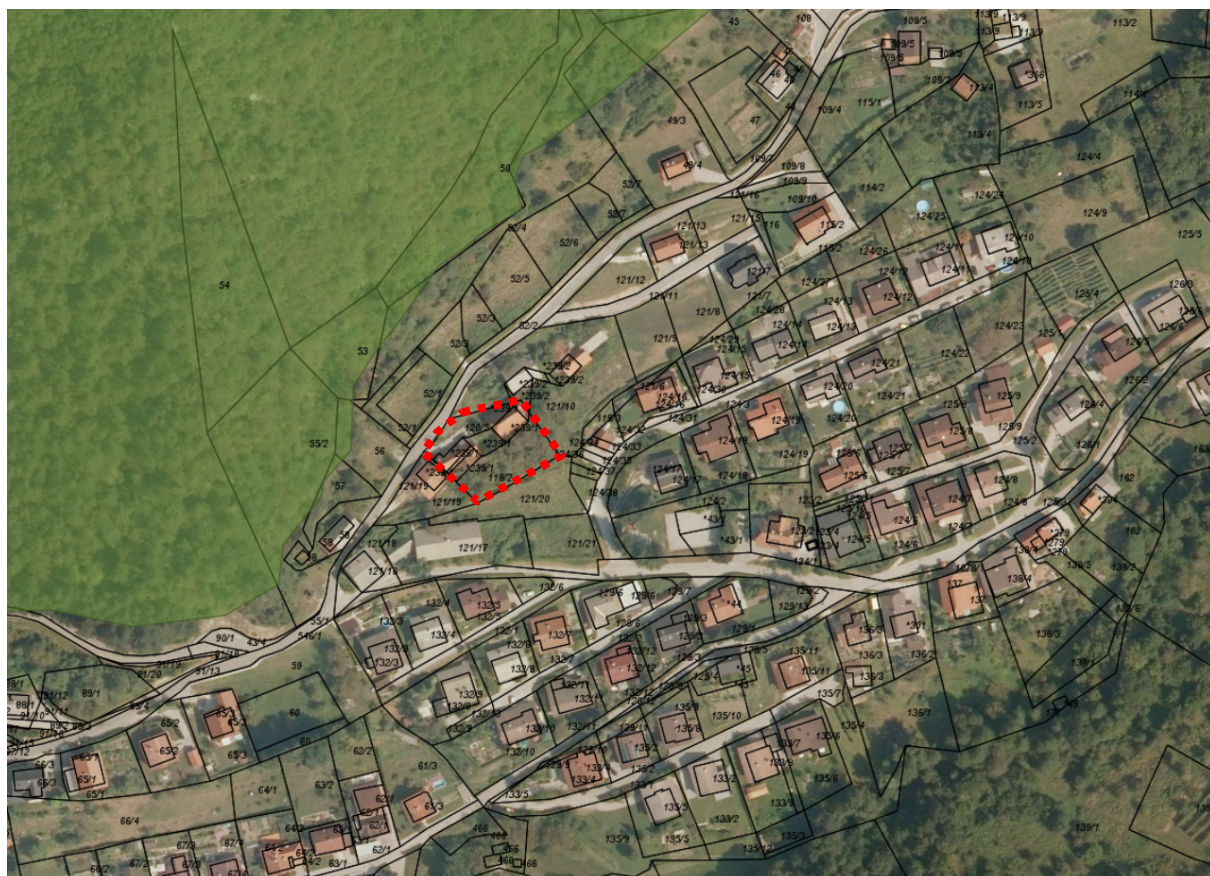
Slika 3: izrez iz karte Varstvo narave (vir: GIS iObčina za Občino Laško, z dne 23.3.2022).

Na območju ni območij varstva narave. V neposredni bližini se nahaja Naravna vrednota - Hum nad Laškim z evidenčno številko naravne vrednote 74.