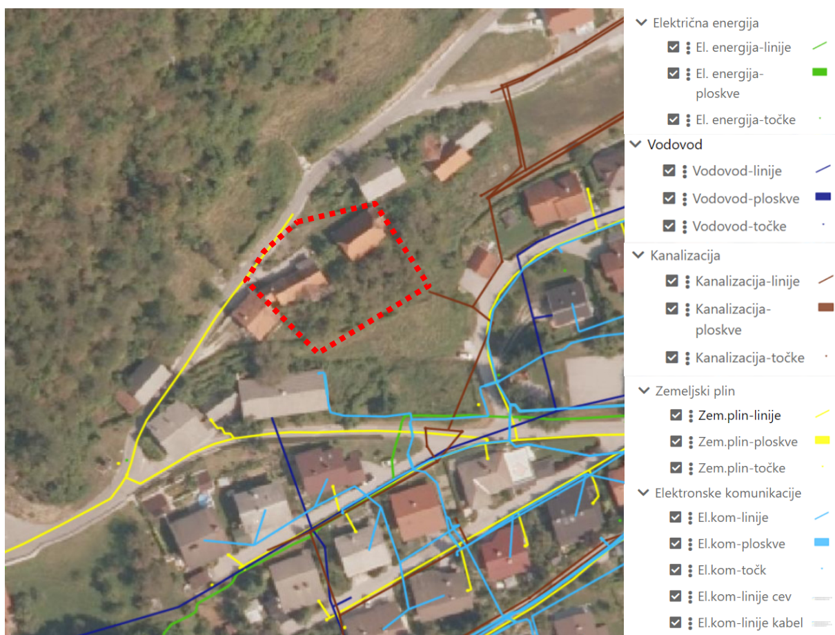
Slika 6: Izrez iz karte gospodarske javne infrastrukture –.

Do lokacije vodi mešani kanalizacijski vod v upravljanju Storitvenega podjetja Laško d.o.o. TK fiksno prizemno omrežje je v oddaljenosti pribl. 20 m.