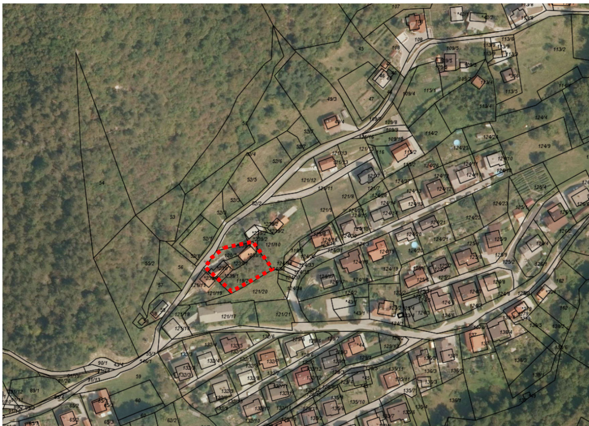
Slika 5: izrez iz karte Vode (vir: GIS iObčina za Občino Laško, z dne 23.3.2022).

Na območju ni varstva vodnih virov. Območje prav tako ni poplavno ogroženo.