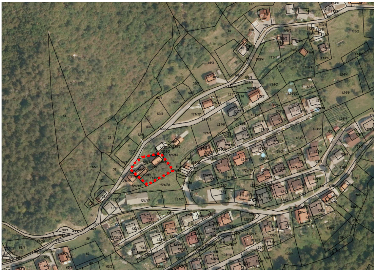
Slika 4: izrez iz karte Kulturna dediščina (vir: GIS iObčina za Občino Laško, z dne 23.3.2022).

Na območje ni območji kulturne dediščine.