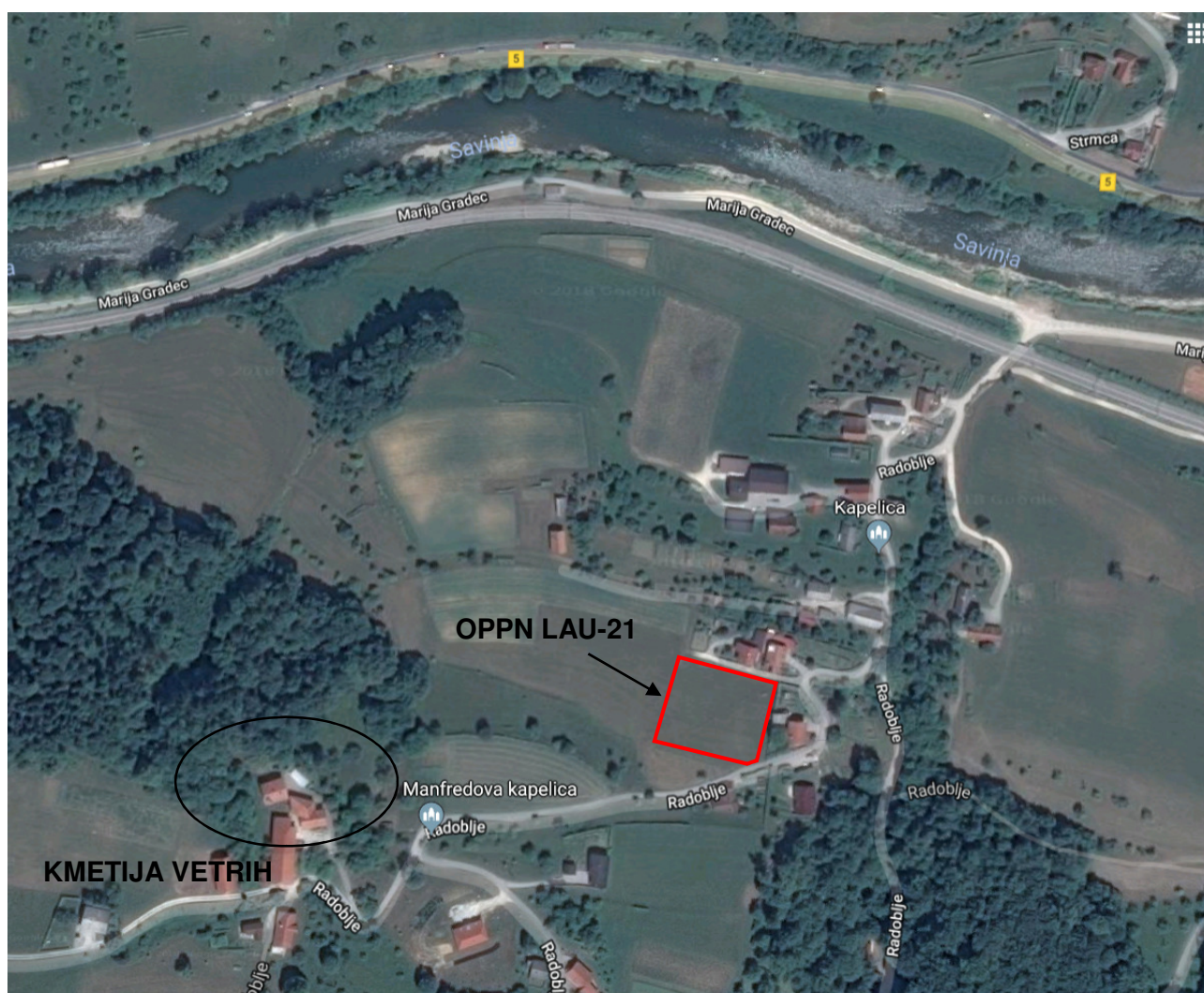
Slika 1: shematski prikaz načrtovane investicijske namere

Kmetija želi na območju OPPN ponuditi dodatno storitev kratkočasnega bivanja v počitniških hiškah, ki bodo locirane ob osnovni stanovanjski stavbi namenjeni bivanju in gostinski ponudbi ter kmetijski stavbi za rejo živali.